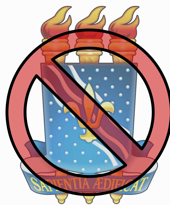
MODIFICAR AS CORES