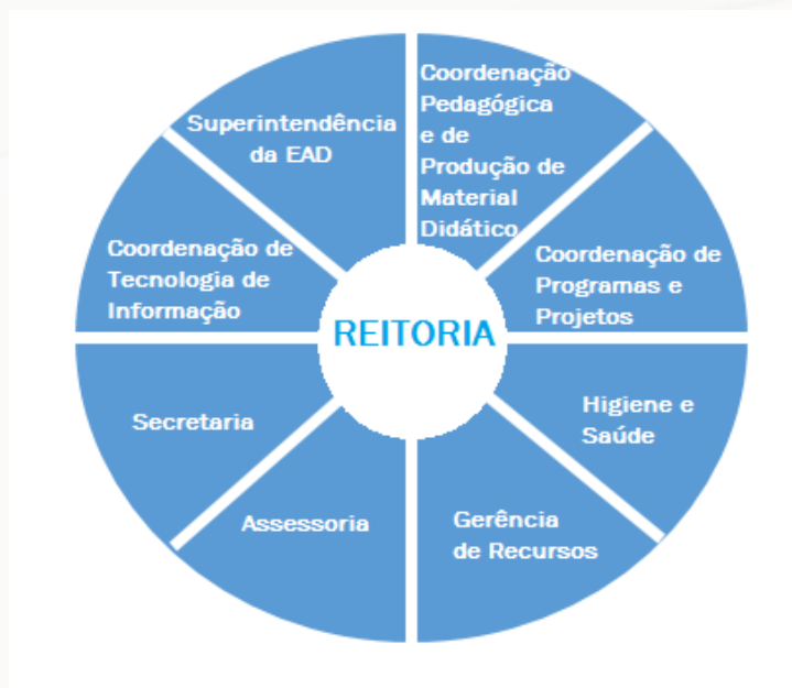
Figura 2: Organograma da SEAD atualmente

Com a apresentação do Organograma que melhor representa a comunicação e as linhas de autoridade na SEAD, a listagem com a estrutura de pessoas que integra a unidade é exposta.