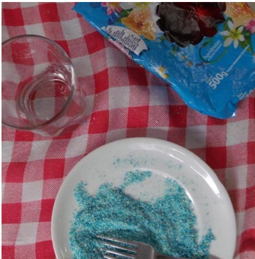
Imagem 1 – Higiene II