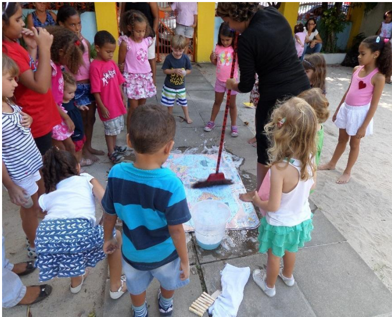
Imagem 7 – Higiene I