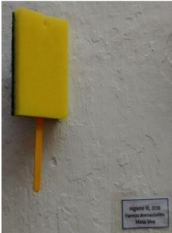
Imagem 3 – Higiene III