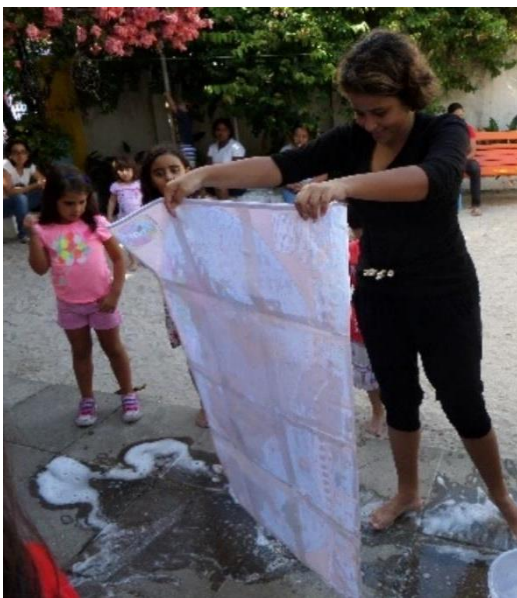
Imagem 8 – Higiene I