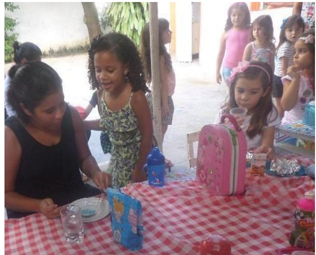
Imagem 2 – Higiene II