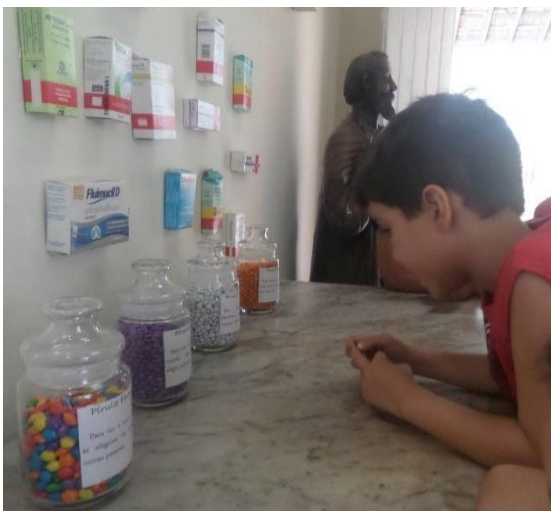
Imagem 5 – Pílulas