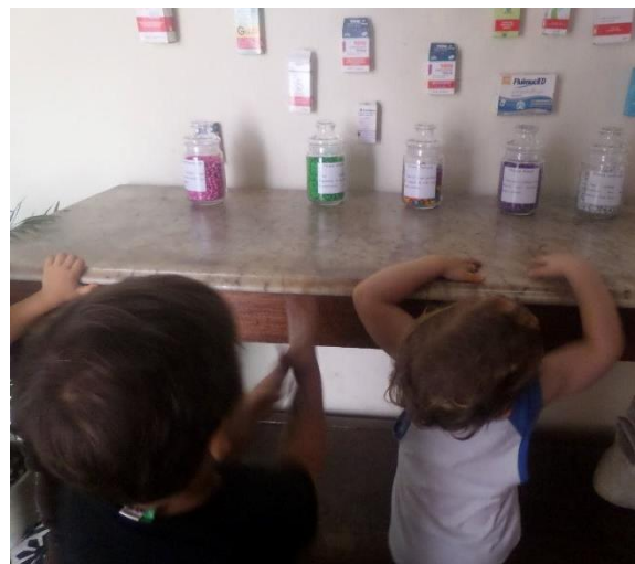
Imagem 6 – Pílulas