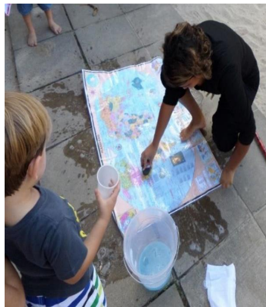
Imagem 9 – Higiene I