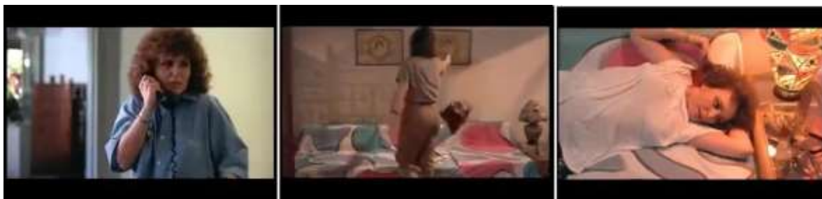
Imagem 5: Consequências da falsa entrevista

Fonte: Fotograma do filme Que bom te ver viva (1989)