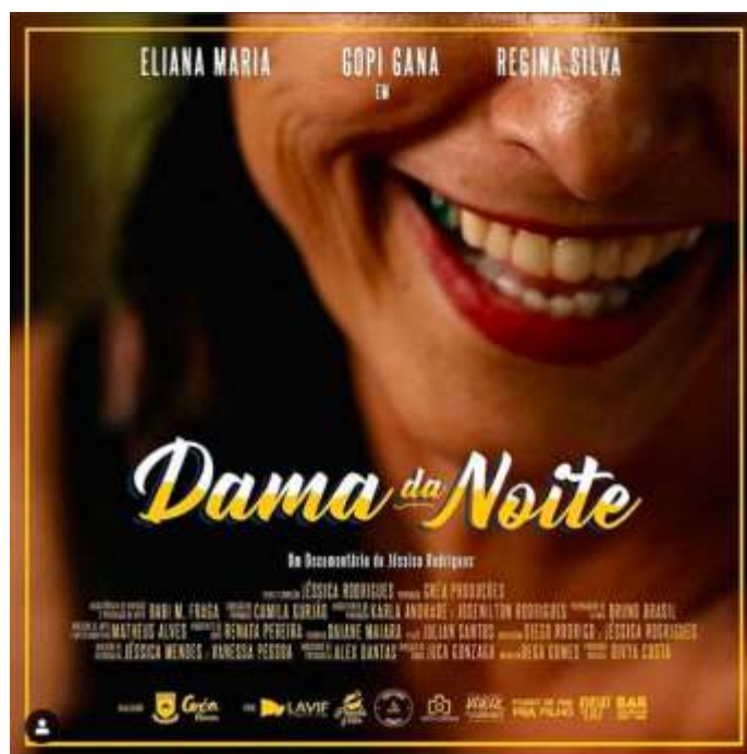
Imagem 1: Cartaz do Dama da Noite

De modo pessoal, iniciei minhas pesquisas no universo do cinema documentário ainda na graduação em Arte e Mídia 1 , quando, no meu trabalho de conclusão de curso tive oportunidade de, para além de uma investigação teórica, realizar uma pesquisa mais minuciosa em torno das práticas de hibridismos entre a ficção e o documentário, através da criação do curta-metragem Dama da Noite 2 (imagem 1).