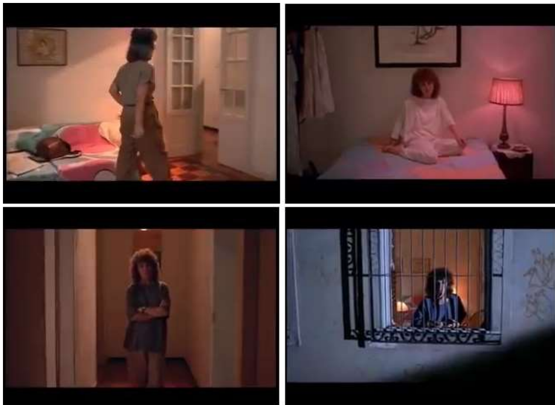
Imagem 9: Cenários do filme Que bom te ver viva

Fonte: Fotograma do filme Que bom te ver viva (1989)