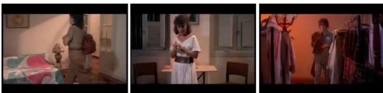
Imagem 16: Figurino como indicador de acesso ao ambiente externo da casa em Que bom te ver viva