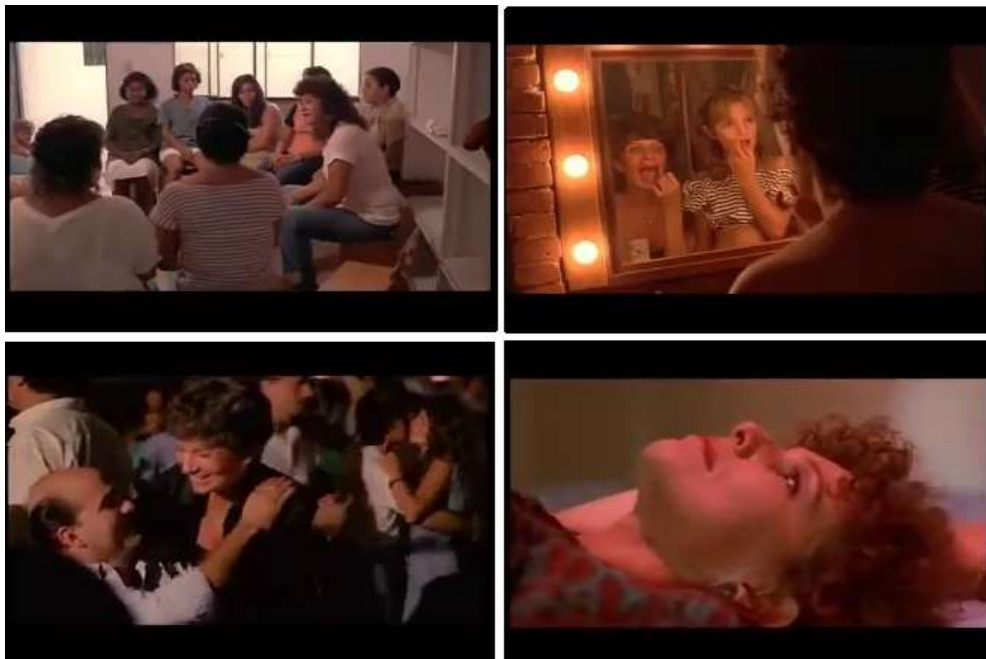
Imagem 3: As mulheres do Que bom te ver viva