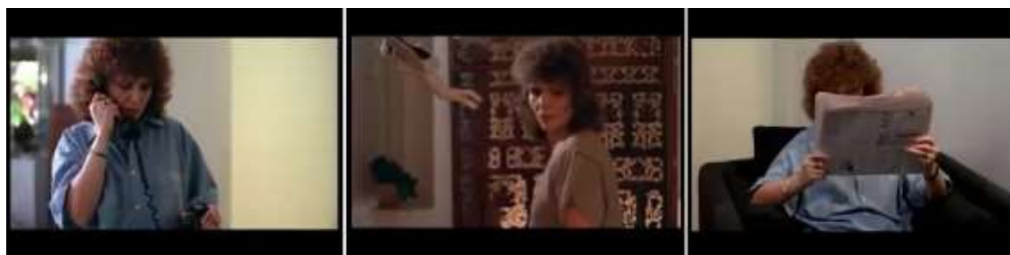
Imagem 12: Modos de utilização dos elementos cenográficos em Que Bom Te Ver Viva