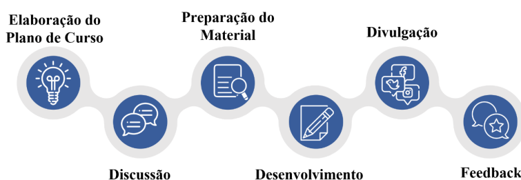
Figura 1 - Processo de Produção dos Cursos

Para a preparação do material audiovisual, foi adotado um processo de produção conforme exemplificado na Figura 1. Inicialmente, foi realizada a elaboração do plano de curso tomando como base a ementa da disciplina, a qual foi discutida durante as reuniões do grupo. Após essa etapa, deu-se início a preparação das aulas com a criação de um roteiro e, por fim, tem-se a etapa de desenvolvimento seguida pela divulgação para o público geral e, ainda, a avaliação dos feedbacks recebidos sobre determinado conteúdo por parte da audiência.