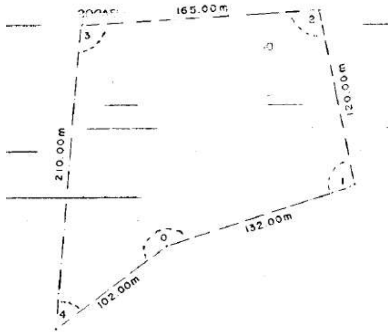
Fig. 1: Caminhamento com ângulos internos.