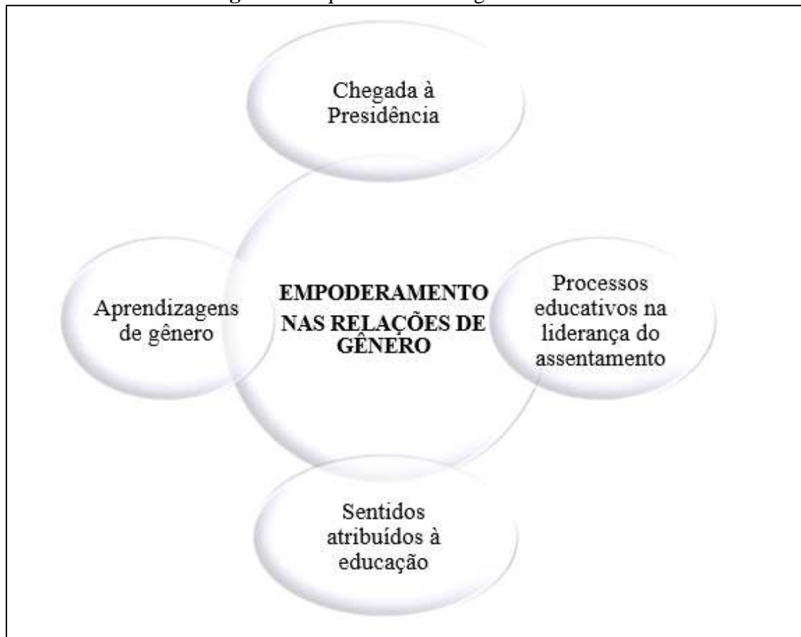
Figura 3: esquema metodológico de análise