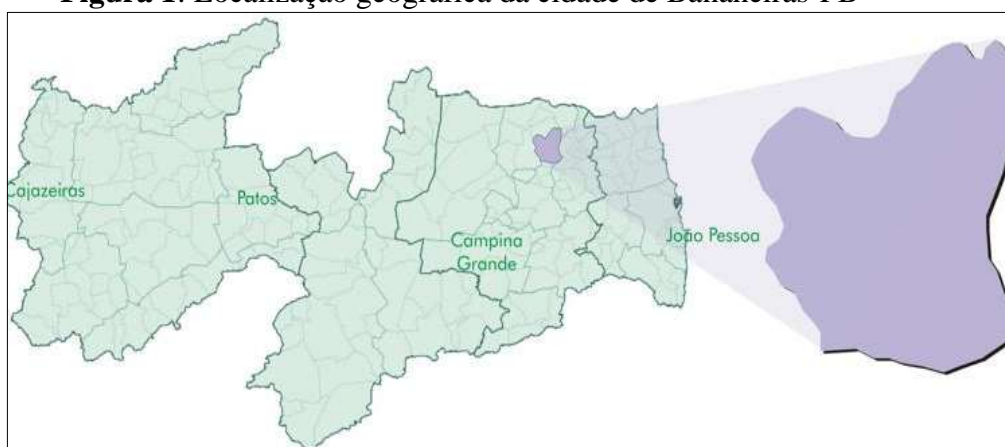
Figura 1: Localização geográfica da cidade de Bananeiras-PB