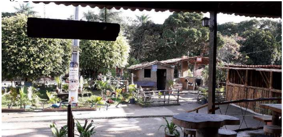
Figura 4: Área externa do restaurante

Observou-se que no item acesso privado à edificação, o estabelecimento apresentou um bom estado de circulação interna. Possui largura adequada para circulação com piso antitrepicante, antiderrapante e escoamento de água adequado, assegurando autonomia e segurança ao público da terceira idade. (Figura 4)