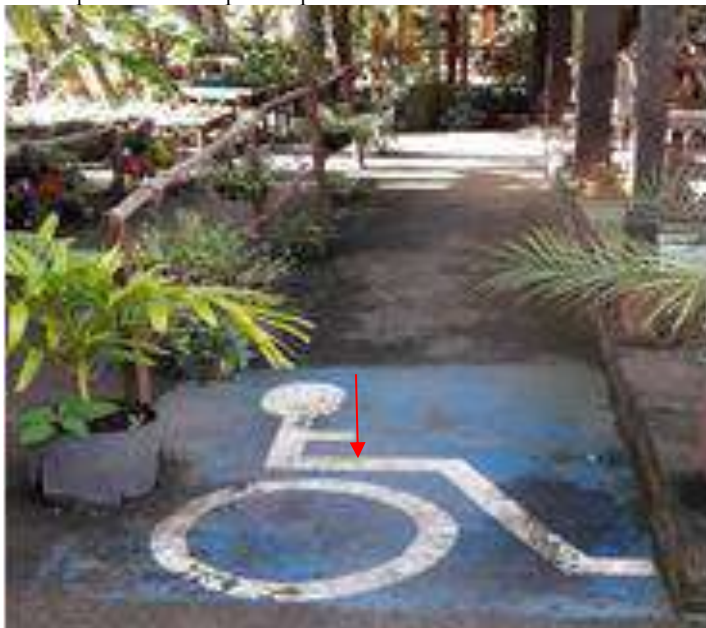
Figura 5: Rampa de acesso para a parte interna do salão do restaurante.

A rampa possui corrimão, porém, ele não condiz com que especifica a norma que preconiza que “os corrimãos podem ser acoplados aos guarda-corpos e devem ser construídos com materiais rígidos. Devem ser firmemente fixados às paredes ou às barras de suporte, garantindo condições seguras de utilização” NBR 9050/2015, (p.63). Além disso, observa-se incongruência ao verificar que a barra é feita de material não apropriado, o que denota fragilidade no acesso ao ambiente, pois com o tempo ela pode deteriorar e apresentar perigo para quem precise utilizá-la. (Figura 5).