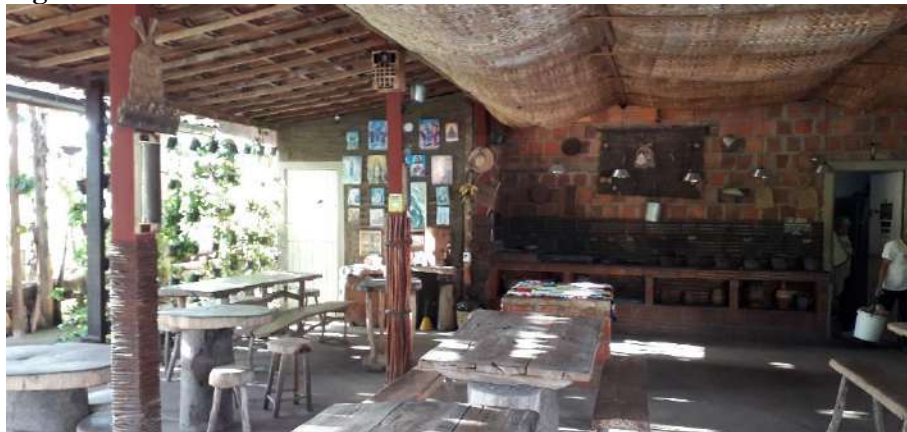
Figura 02: Parte interna do restaurante rural.

histórico de Areia, além disso, é oferecido atração musical durante a refeição. O serviço de alimentação oferecido é o buffet em um valor de dezoito reais (R$ 18,00).