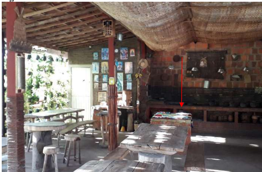
Figura 5: Salão interno do restaurante.

Constatou-se que o piso do salão é antitrepicante e antiderrapante, apresentando adequação com o que preconiza a lei.