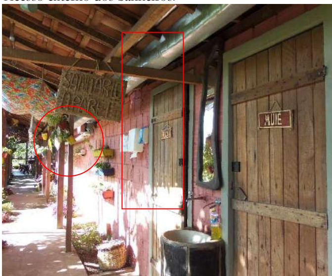
Figura 7: Acesso externo dos banheiros.

Identificou que os acessórios para sanitário estão em disposição que dificulta o acesso para um idoso cadeirante, para a ABNT (2015, p.105), “os acessórios tais como cabides, saboneteiras e toalheiros, devem ter sua área de utilização dentro da faixa de alcance confortável estabelecida”. O espelho também se mostrou inadequado, ABNT (2015, p.105), preconiza que “os espelhos podem ser instalados em paredes sem pias. Podem ter dimensões maiores, sendo recomendável que sejam instalados entre 0,50 m até 1,80 m em relação ao piso acabado “. (Figura 7)