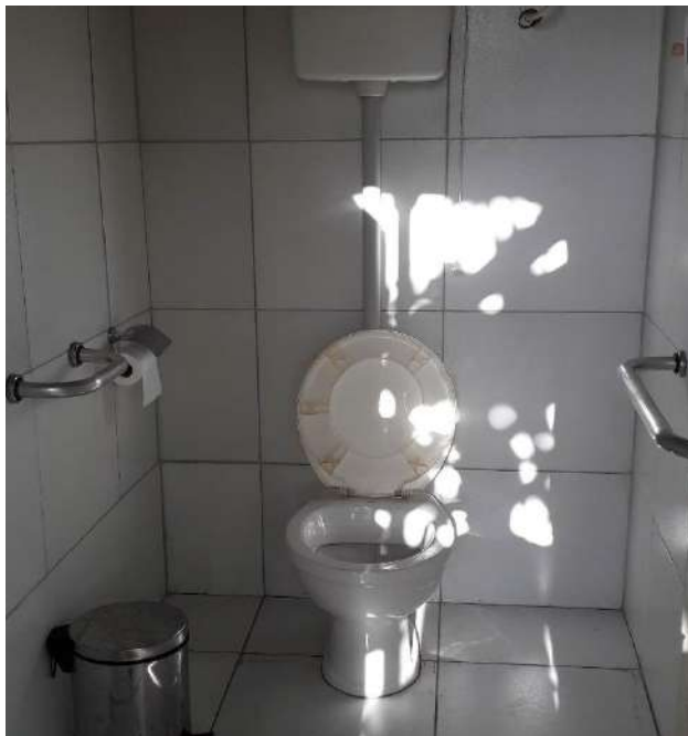
Figura 8: Parte interna do banheiro

Outro ponto negativo, foi a ausência de pia dentro de cada banheiro, esse fato pode provocar uma quebra na privacidade dos usuários e gerar transtorno caso o estabelecimento esteja lotado.