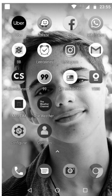
Figura 2: Telas iniciais de celular da autora e da aluna F, com aplicativos mais usados ou aparentes.

E o que têm em comum as descoleções minha, de L e de F? Enviamos e-mails, participamos de redes sociais (as mesmas e estamos conectadas), navegamos, usamos transporte por aplicativos, escaneamos documentos. A estudante F, hoje com 26 anos, também iniciando o curso de Letras, tem relação íntima com a música e deseja aprender línguas usando o smartphone . Em que podemos nos conectar? E em que nos distanciamos, afinal?