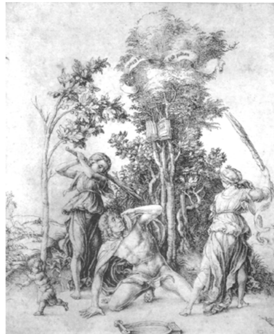
Albrecht Dürer, A Morte de Orfeu, 1494 (Hambourg, Kunsthalle) (CARERI, 2003, p. 46)

Se, para Gluck, o final feliz é possível, para alguns pintores, gravuristas e escultores, o diasparagmós báquico será o tema eleito para dar plasticidade ao mito clássico, como ocorre na imagem de Albrecht Dürer, na gravura intitulada Morte de Orfeu, de 1494.