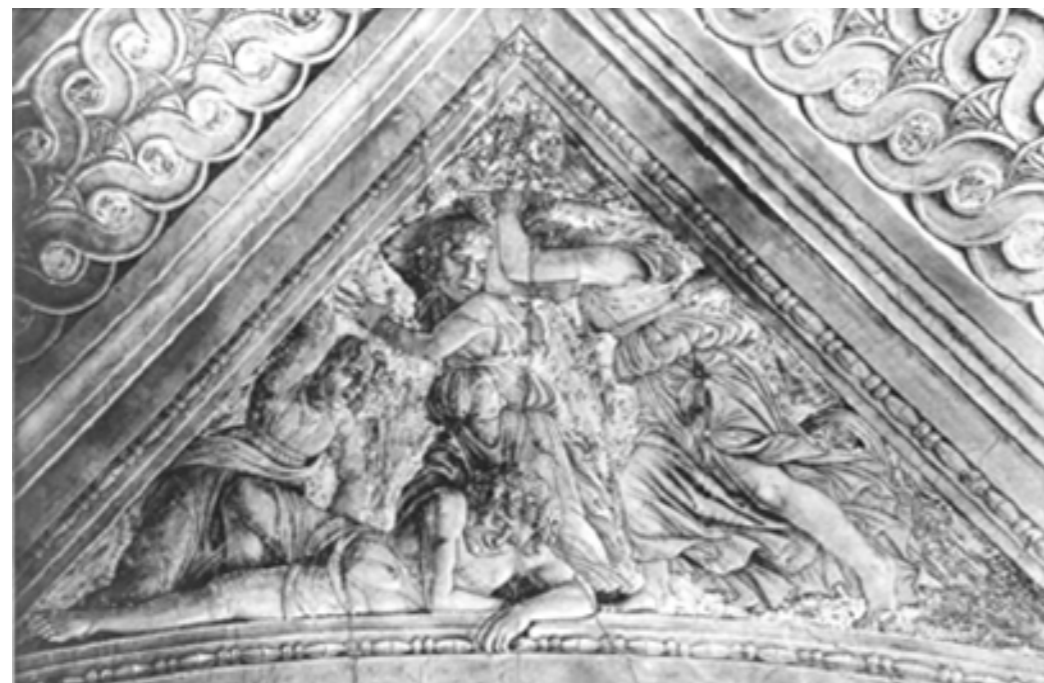
Andrea Mantegna, A morte de Orfeu (palácio de Mantoue) (CARERI, 2003, p. 51)

lhança no conjunto de bacantes a agredir Orfeu caído ao chão. As obras se diferenciam pela técnica, suporte e estilo, todavia, apresentam o mesmo pathosformel.