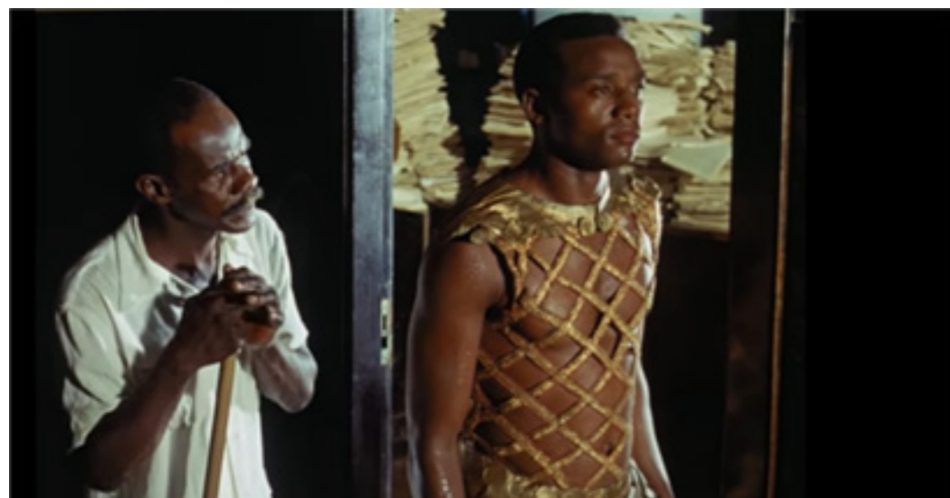
Orfeu negro (CAMUS, 1959)

Orfeu, além de condutor de bonde, canta para o sol nascer, remetendo a imagem do sambista à ideia apolínea da condução do carro do Sol, ou seja, de responsabilidade pelo amanhecer de cada dia. Outras personagens que colaboram na economia do mito serão encontradas em Orfeu Negro: Hermes será o chefe dos condutores de bonde; Caronte será retratado como um faxineiro da repartição pública em que Orfeu vai buscar notícias sobre sua amada desaparecida, como se observa na imagem: