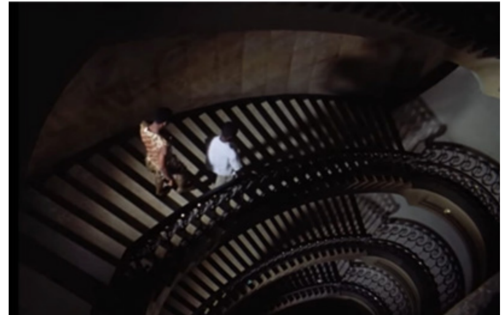
Orfeu negro (CAMUS, 1959)

Caronte, o condutor da barca que leva os mortos para a travessia do rio Estige até seu destino final no Hades, será também, no filme aquele que conduz o sambista na busca sobrenatural por Eurídice. Caronte conduz Orfeu para ter contato com os mortos, em uma toma de plasticidade ímpar.