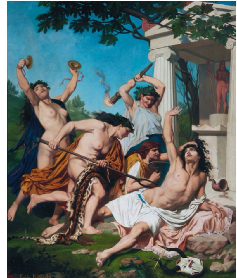
Morte de Orfeu

Acrescento à reflexão de Careri, que não se limita ao mito de Orfeu, outras obras que repetem o tema do dilaceramento pelas mãos das bacantes, caso da obra de Jean Baptiste Bin, de 1874.