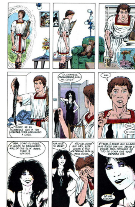
(GAIMAN, TALBOT, 1993, p. 22)

Vale ressaltar que a morte de Eurídice segue o padrão da tradição clássica. Não obstante, a trajetória de busca empreendida por Orfeu apresenta detalhes surpreendentes, como o momento em que o cantor vai ter com sua tia Morte e tem um choque com o ambiente em que ela vive, que remete à segunda metade do século XX: