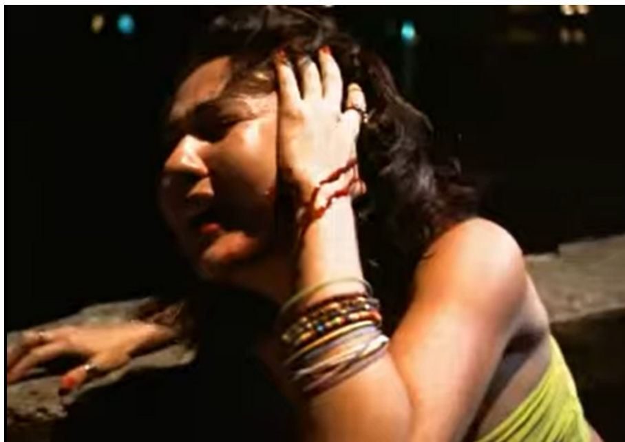
Figura 4: Frame do filme Amarelo Manga na marca de 1:13'13".