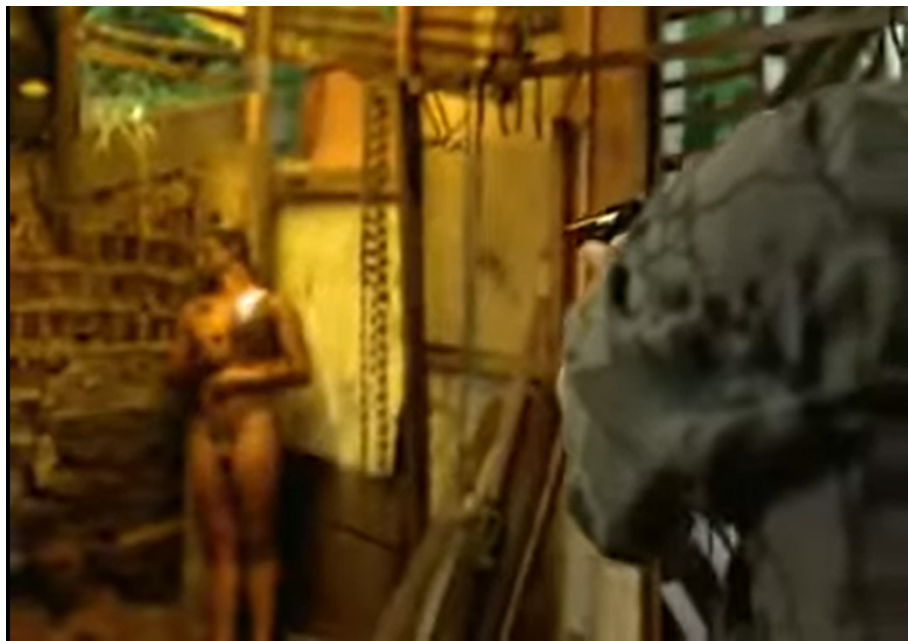
Figura 9: Frame do filme Amarelo Manga na marca de 26'41".

A representação do abjeto traz consigo uma presença inevitável que sua concretização enquanto imagem provoca: o horror. Não o horror moralista em face da existência do que a boa ética condena, mas um horror mais profundo, advindo das profundezas da alma humana — um horror de temores pré-históricos e incomensuráveis — e que aflora em toda sua potência original. O horror com seu lado grotesco, com seu lado repulsivo, seu lado de terror, é um dos elementos característicos do Cinema Marginal. (Ramos, 1987, p. 118).