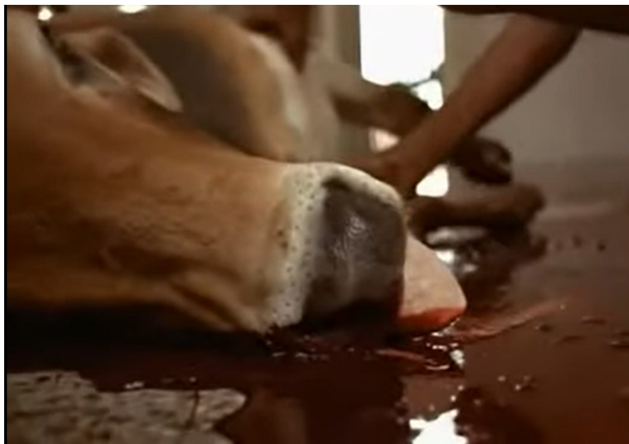
Figura 5: Frame do filme Amarelo Manga na marca de 41'14".

brutalidade da vida todos os dias assim como as personagens do filme. “O animalesco aparece, então, como imagem da degradação ou da violência”. (Ramos, 1987, p. 117).