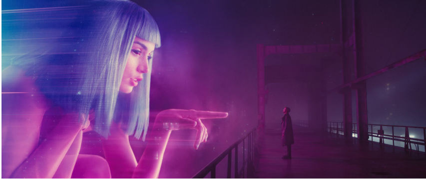
Figura 1. “You look lonely, I can fix that.”