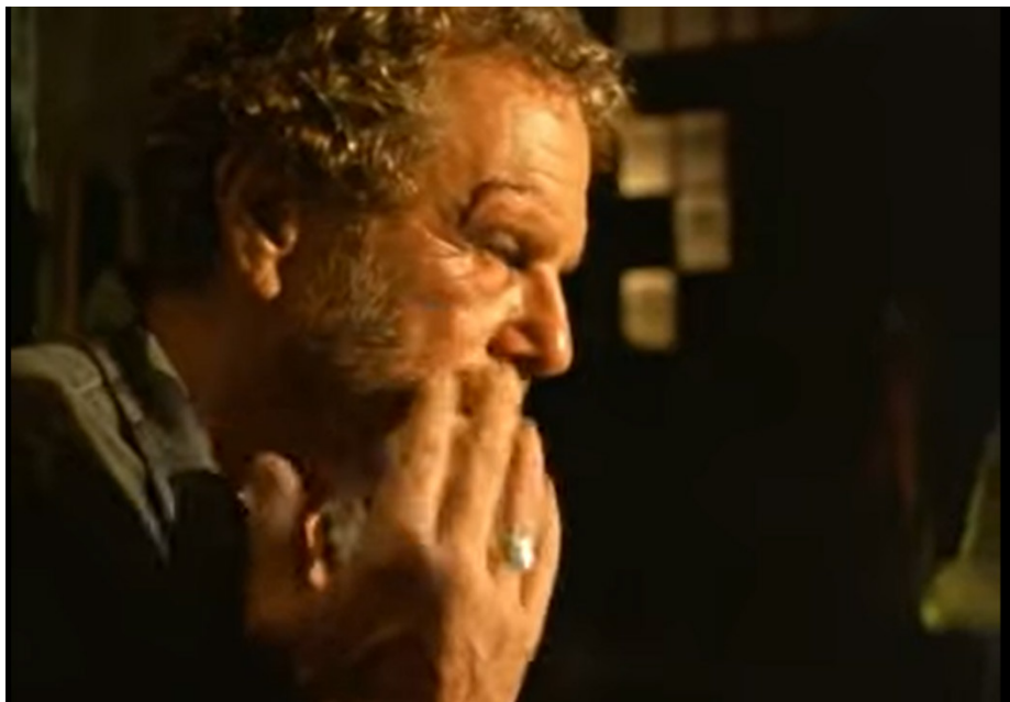
Figura 3: Frame do filme Amarelo Manga na marca de 1:05'39".

pela boca ou o próprio sangue espalhado pelo rosto e outras partes do corpo". (Ramos, 1987, p. 117).