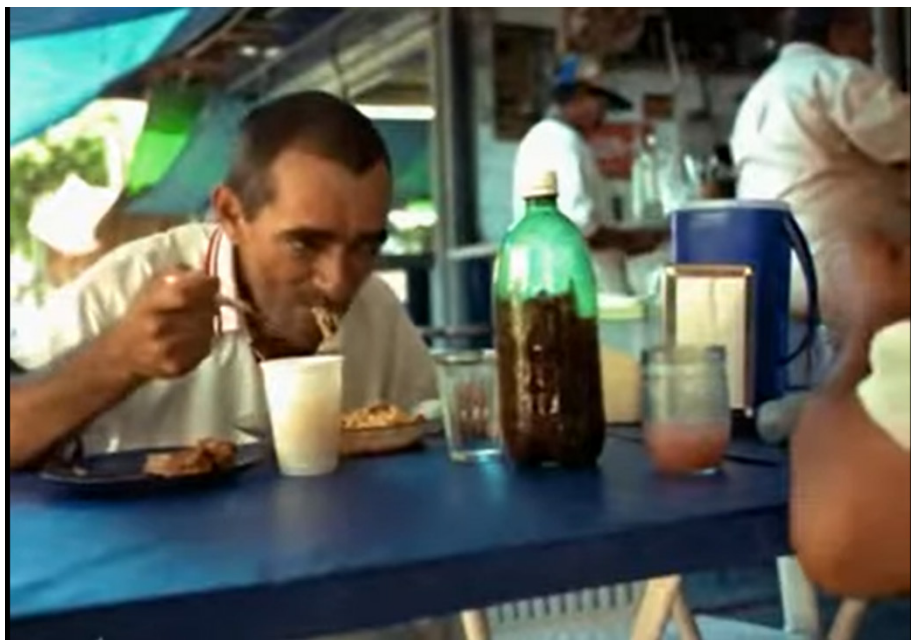
Figura 2: Frame do filme Amarelo Manga na marca de 36'26".

Uma das imagens preferidas do Cinema Marginal é a da “deglutição aversiva”. O personagem enche à boca de comida, acima de sua capacidade de mastigar, e deixa a massa formada escapar pelos cantos da boca. Ou, então, abre os dentes de forma ostensiva deixando o espectador antever o bolo de alimento e saliva que se forma no interior desta. (Ramos, 1987, p. 116).