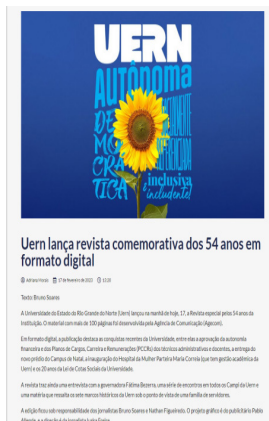
Figura 1: Divulgação da revista comemorativa dos 54 anos da Uern.