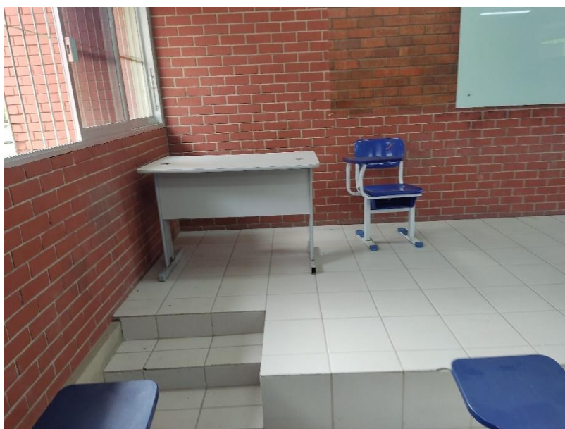
Figura 2 – Situação da pintura das salas do Bloco CTB

As paredes, por sua vez, são de Tijolo aparente e não apresentam maiores problemas para além do desgaste natural da pintura devido a ação do tempo. Há, portanto, a necessidade de pintura das salas do bloco. Além disso, como houve uma redução no tamanho do quadro da sala, há uma parte não pintada, como mostra a Figura 2.