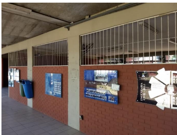
Figura 5 – Abertura nas paredes com grades para ventilação com segurança: necessidade de colocar janelas

Outro aspecto importante em relação às janelas é a necessidade de colocação de janelas na parede sul das salas de aula, junto ao corredor. Essas aberturas com grade foram pensadas para a melhoria da ventilação (ver Figura 5), mas solicita-se a troca das grades por janelas basculantes que garantem segurança, ventilação e fechamento quando da climatização das salas com aparelhos de ar-condicionado.