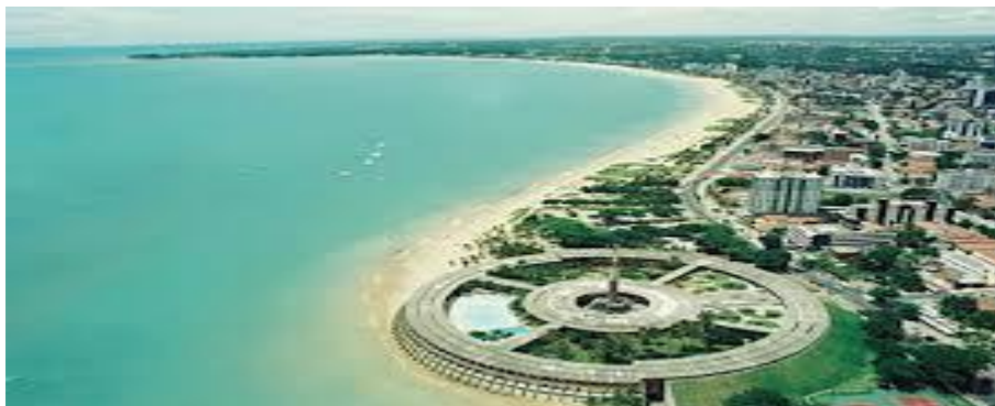
Figura 13 - Vista Aérea da Praia de Tambaú

paraibano conta com diversos elementos que podem contribuir para o avanço de suas potencialidades turísticas, esse autor ele cita além da forte cultura nordestina, sua fauna e sua flora, atraindo assim não apenas turistas locais, mas também turistas de outras regiões do Brasil e de outras partes do planeta.