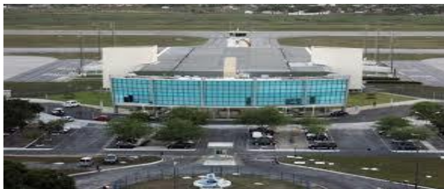
Figura 15 - Vista Aérea do Aeroporto Castro Pinto

Quanto ao ingresso do turista no município o plano cita os acessos aéreo, rodoviário, aquaviário, ferroviário, sistemas de transporte no destino (que engloba ônibus urbanos com linhas normais, taxi, entre outros).