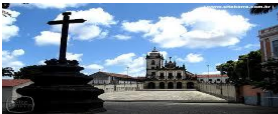
Figura 20 - Entrada do Mosteiro de São Francisco