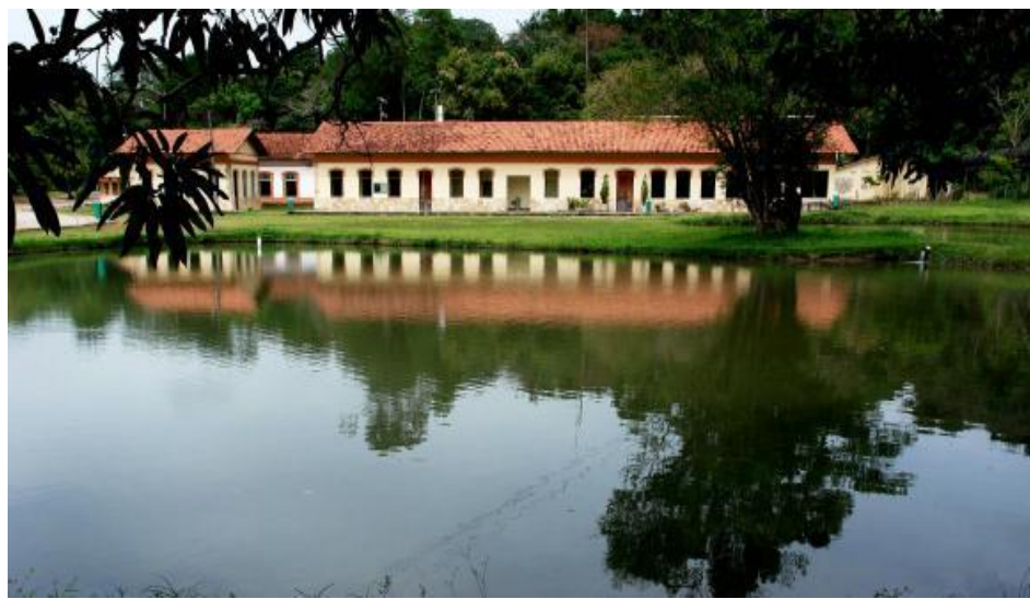
Figura 19 - Casa Sede do Jardim Botânico de João Pessoa