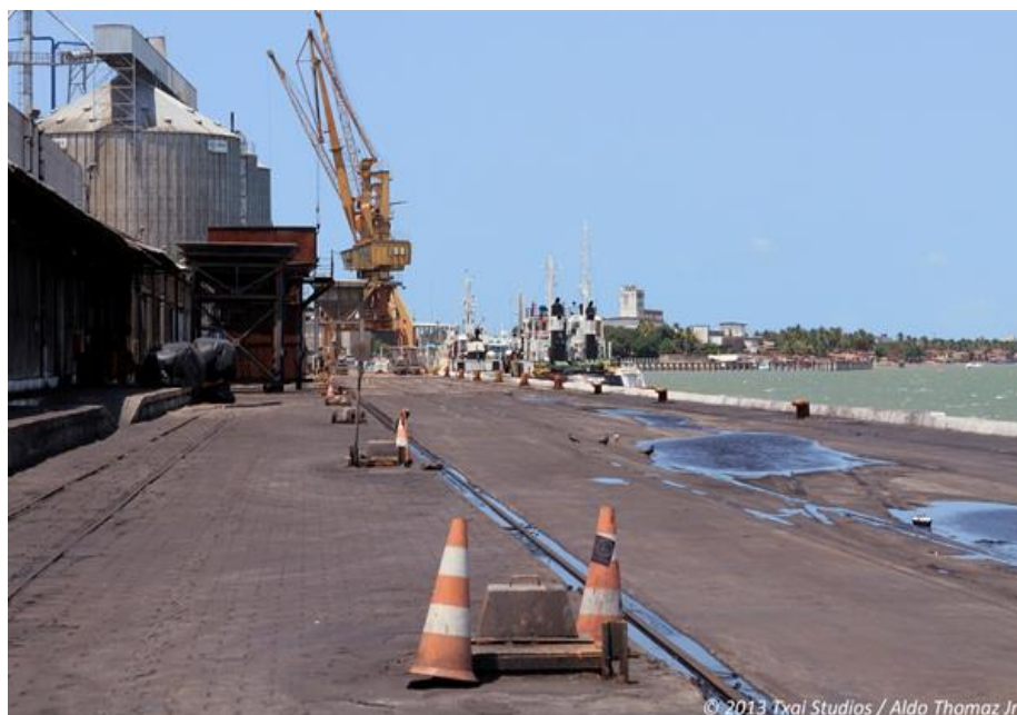
Figura 23 - Área de desembarque do Porto de Cabedelo

Cabedelo continua com condições limitadas de embarque e desembarque de passageiros.