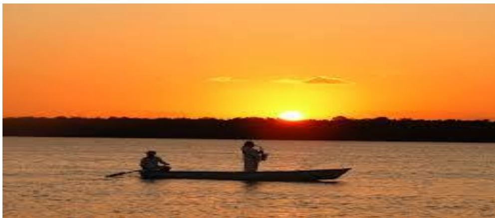
Figura 21 - Pôr-do-sol na Praia do Jacaré

Ainda existem os eventos programados e realizações técnicas, científicas e artistíssimas como a Previa Carnavalesca Folia de Rua, Réveillon Circuito Brasileiro de Vôlei de Praia, São João, Estação do Som, Carnaval Tradição.