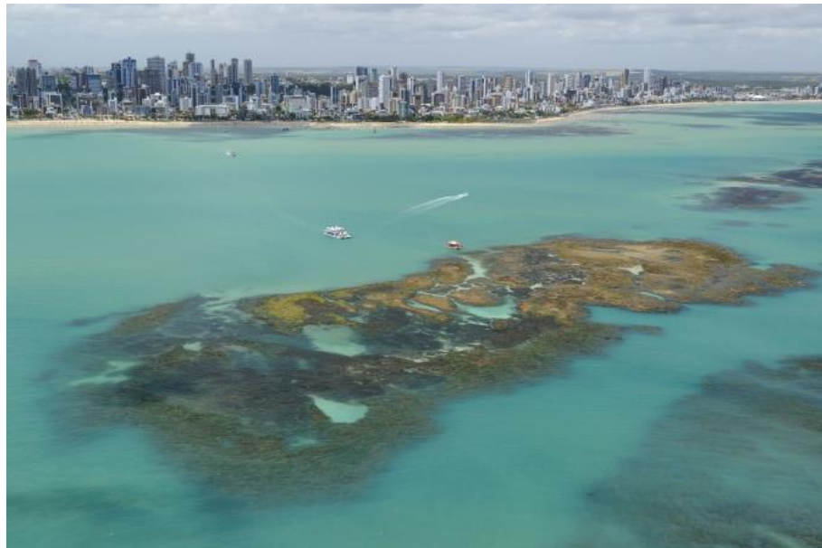
Figura 16 - Vista Aérea de Picaozinho

Parque Zoobotânico Arruda Câmara, Ponta do Seixas, Jardim Botânico Benjamim Maranhão e Parque Solon de Lucena.