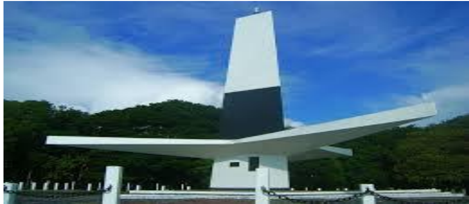
Figura 18 - Farol do Cabo Branco