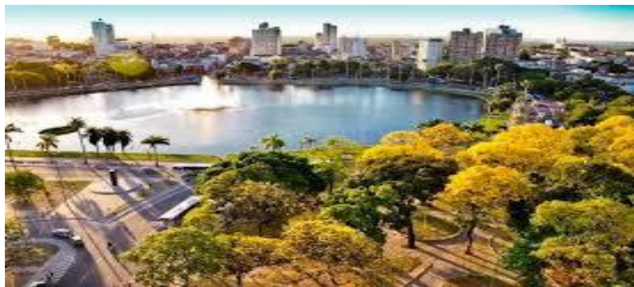
Figura 17 - Vista do Parque Solon de Lucena

Quanto aos atrativos culturais comercializados em João Pessoa é citado o Centro Histórico de Joao Pessoa, Complexo de São Francisco, Hotel Globo, Estação Cabo Branco de Ciências, Cultura e Artes, farol do Cabo Branco, Mercado de Artesanato Paraibano, todos localizados na cidade de João Pessoa, mas cita ainda alguns que ainda não e comercializado, como Praça da Independência, Casa do Artista popular, Praça Joao Pessoa, Fazenda da Graça, Espaço Cultural José Lins do Rego, e também atrativos em cidades vizinhas como Por do Sol do Jacaré e Areia Vermelha – Cabedelo, Praias do Litoral Norte e praias do Litoral Sul.