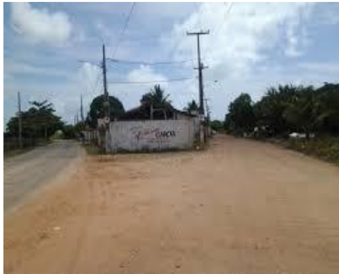
Figura 22 Acesso a praia de Barra de Gramame