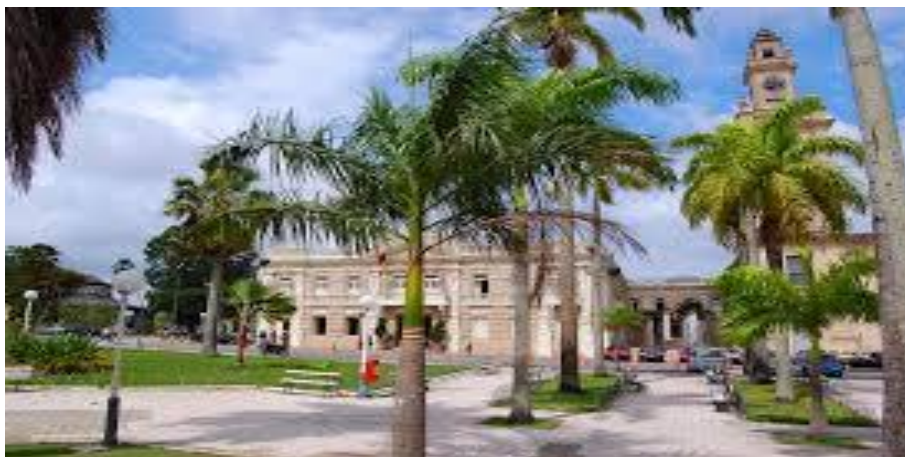
Figura 14 - Vista da Praça João Pessoa

Os planos e ações de Infraestrutura não menciona qualquer tipo de melhoria, implantação ou reforma relacionado a equipamentos médicos, quanto a melhoria do fornecimento de energia, apenas cita a melhoria e expansão da iluminação pública (pag. 115 do PDTur), quanto a proteção, o Plano cita a implementação de postos Salva-vidas apenas e quanto a estrutura urbana ela é, mas abrangente, pois cita diversas ações de melhoria urbana, como por exemplo, recuperar monumentos e imóveis (pag. 115), Despoluir e preservar a Lagoa do Parque Solon de Lucena.