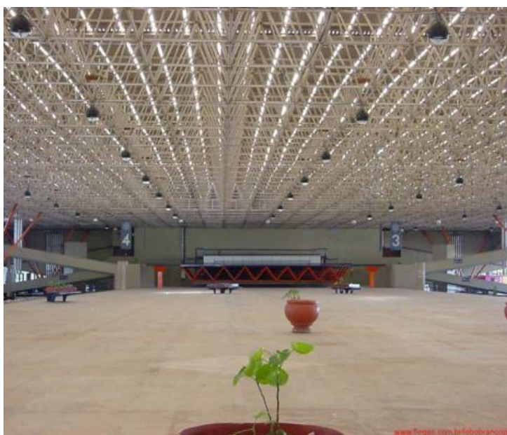
Figura 25 - Vista interna do Espaço Cultural