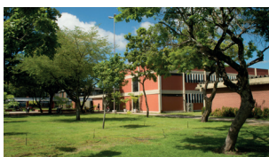
CE - Campus I