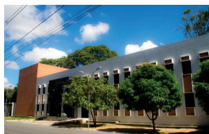
Bloco de Mídias Digitais - Campus I