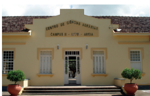
CCA - Campus II