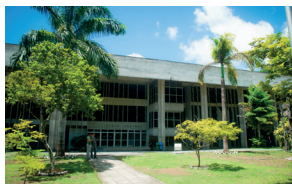
Biblioteca Central - Campus I