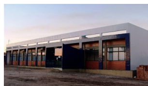
Litoral Norte - Campus IV