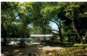
Jardim do CCHLA - Campus I