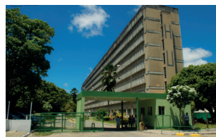
Hospital Universitário - Campus I