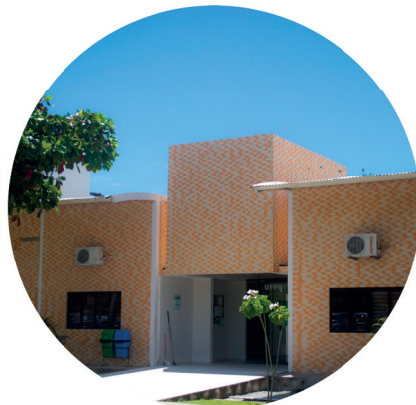
UFPB Virtual - Campus I