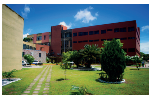
Reitoria - Campus I