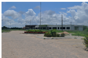
Bananeiras - Campus III