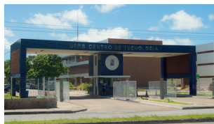
CT - Campus I