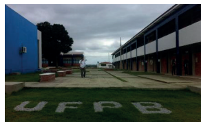
Litoral Norte - Campus IV