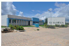
Bananeiras - Campus III