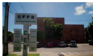
CCS - Campus I