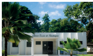
Clínica Escola de Fisioterapia - Campus I