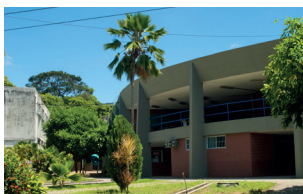
CCEN - Campus I