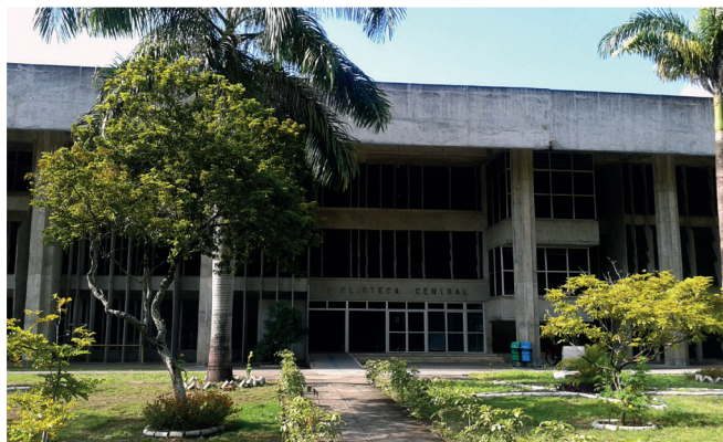
Biblioteca Central - Campus I

BS/CCAIE - Centro de Ciências Aplicadas e Educação