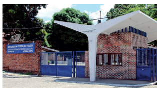
CCAIE - Campus IV