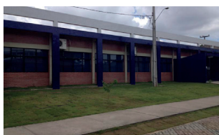
Litoral Norte - Campus IV