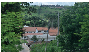
Bananeiras - Campus III