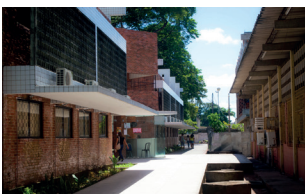
CCTA - Campus I