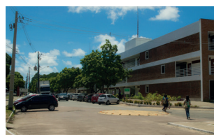
CT - Campus I