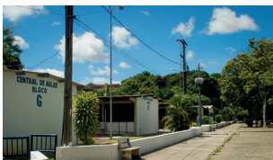
Central de Aulas - Campus I