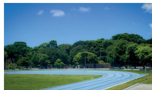
Pista de Atletismo - Campus I