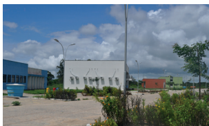
Bananeiras - Campus III