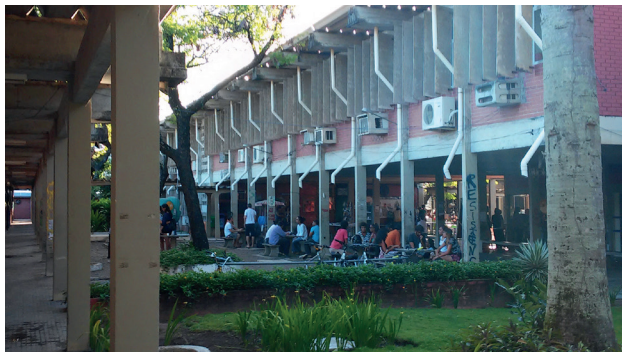
Praça da Alegria - Campus I