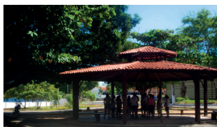
Coreto - Campus I