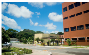
Reitoria - Campus I