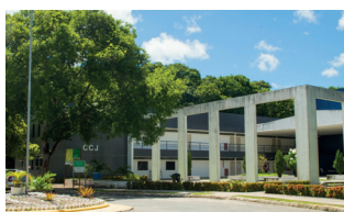
CCJ - Campus I