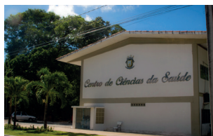
CCS - Campus I