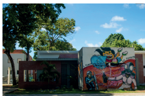
Bloco de Música - Campus I