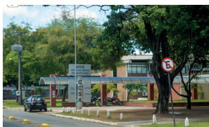
CCSA - Campus I