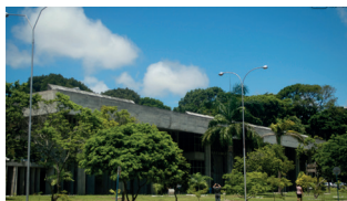
Biblioteca Central - Campus I