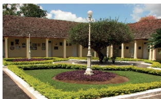
CCA - Campus II