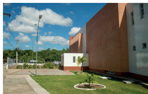
Teatro Radegundes Feitosa - Campus I