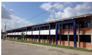
Litoral Norte - Campus II