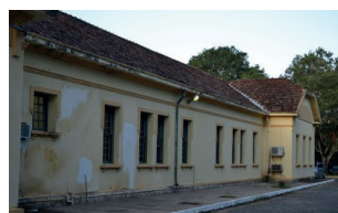
Areia - Campus II