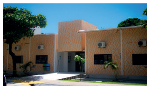
UFPB Virtual - Campus I