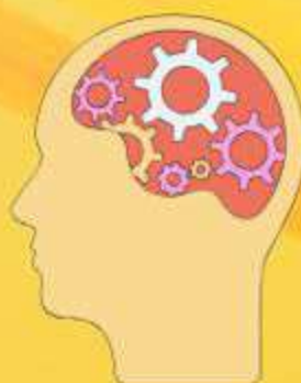
PROBLEMAS NEUROLÓGICOS COGNITIVOS