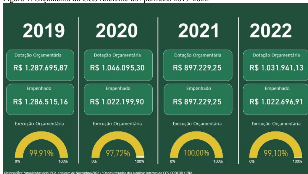
Figura 1: Orçamento do CCS referente aos períodos 2019-2022

A partir da análise da Figura 1, fica evidente que a Dotação Orçamentária do Centro vem sendo reduzida desde o ano de 2019. É importante ressaltar que no caso do ano de 2021 houve pouca arrecadação com projetos de extensão.