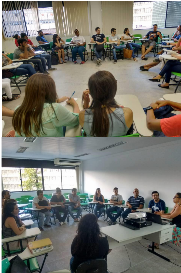
Figura 3 e 4. Mostras de extensão para os alunos do primeiro período

Em 2016, foi organizado o I Encontro de Extensão do CCM (figuras 5 e 6). Teve duração de dois dias e teve tema: “A importância da extensão universitária na formação em saúde e no currículo de Medicina”. O encontro proporcionou um momento de interação entre os extensionistas, onde puderam compartilhar suas vivências e participantes puderam conhecer as ações de cada projeto apresentado.