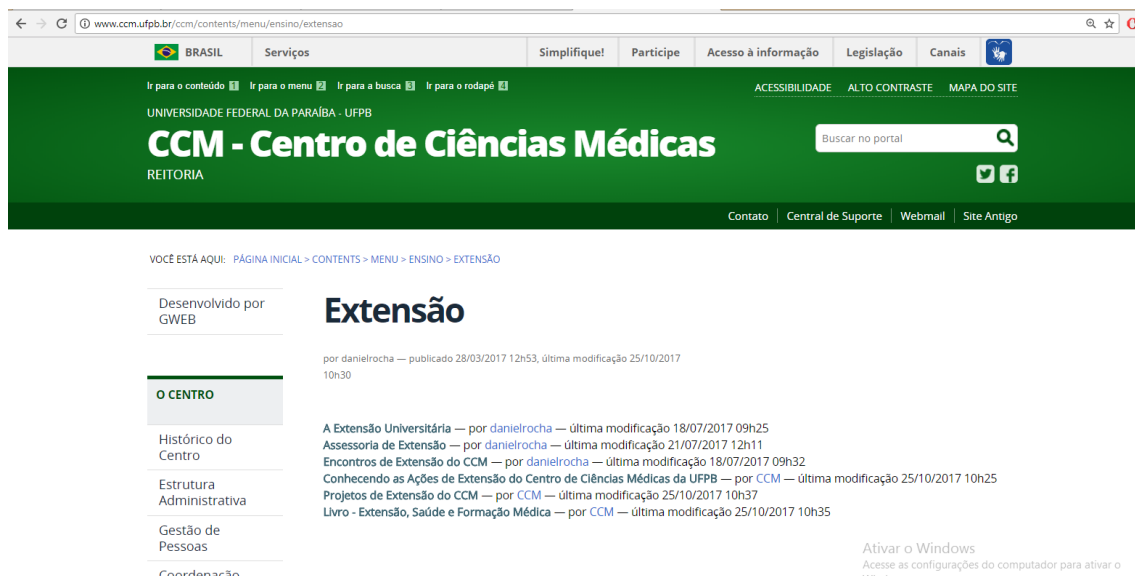
Figura 8. Área de Extensão no sítio antigo e no sitio novo do CCM