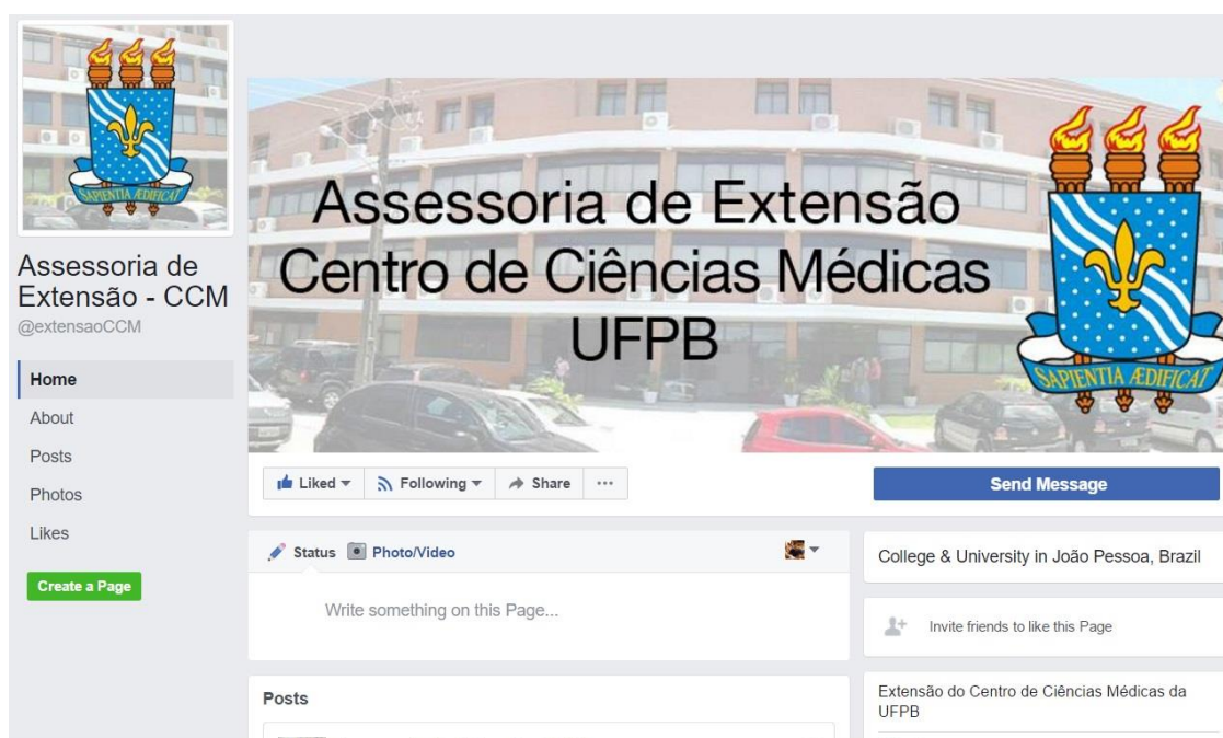
Figura 7. Perfil da Assessoria de Extensão no Facebook

O perfil da Assessoria de Extensão no Facebook 5 já conta com 553 curtidas.