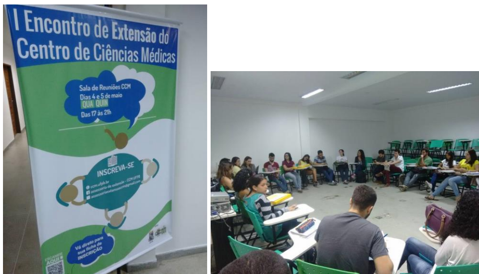
Figura 5 e 6. I Encontro de Extensão do CCM

Em 2017, foi organizado o II Encontro de Extensão do CCM , sob o tema: “Os significados da Extensão para a saúde e a qualidade de vida dos estudantes universitários”. O encontro foi vivenciado em um único dia, onde houve uma roda de conversa sobre a saúde e qualidade de vida dos estudantes e como a extensão universitária pode promover o autocuidado e autoconhecimento para assim poder cuidar das outras pessoas. Ademais, promoveu-se a participação de estudantes, técnicos administrativos, profissionais de saúde e movimento populares.