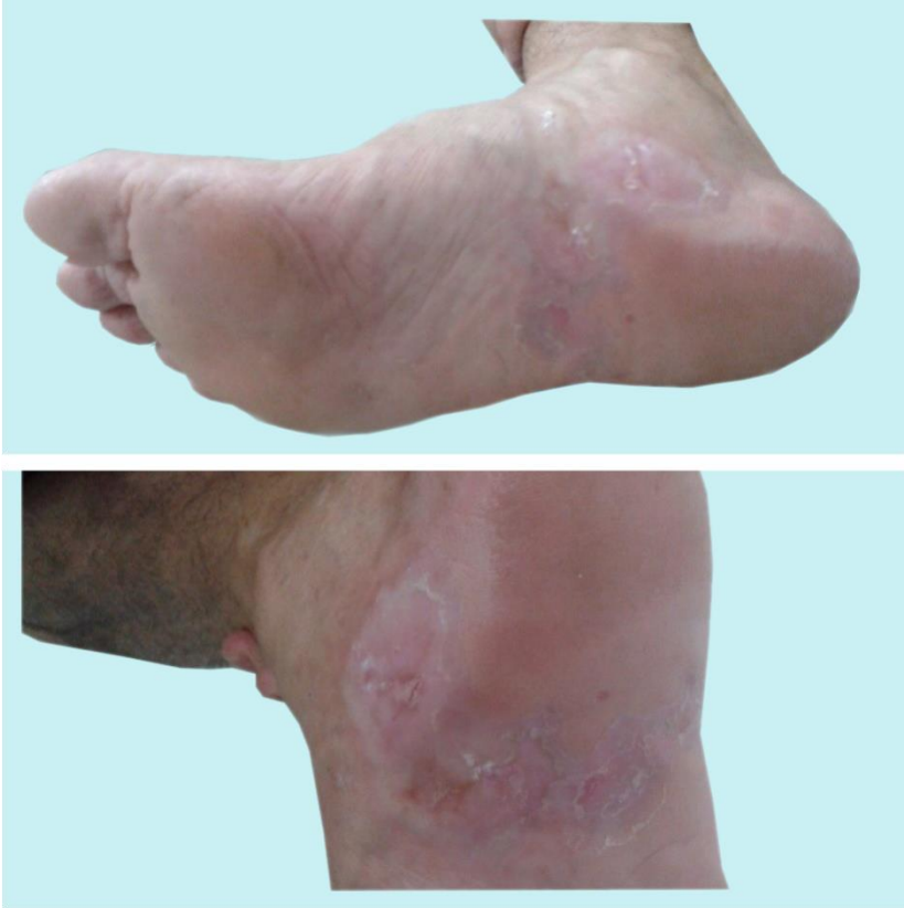
Figura 1 – Líquen plano plantar. Placa eritemato-descamativa no cavo plantar direito.