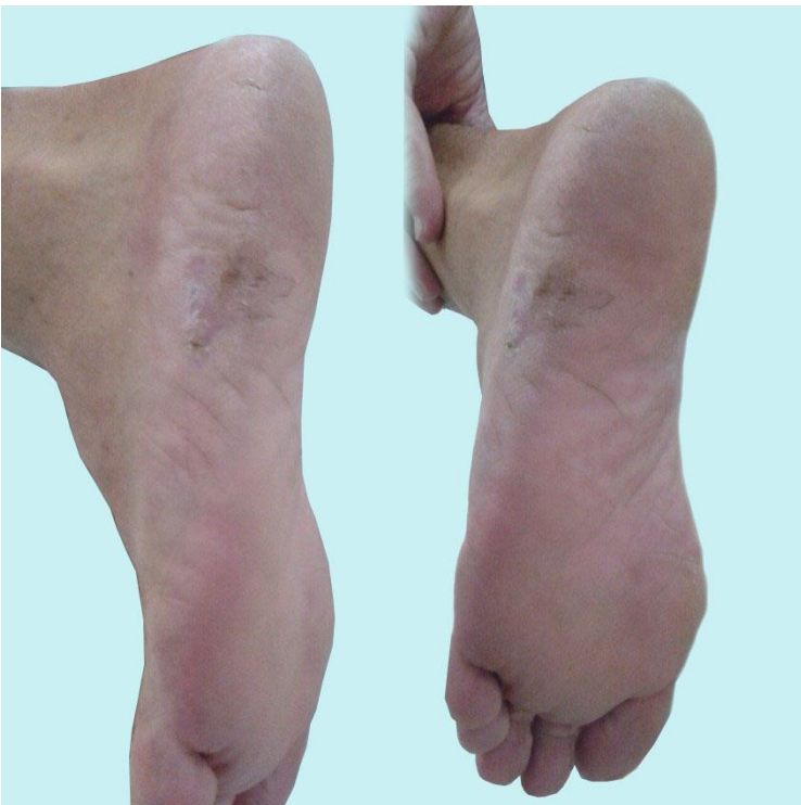
Figura 2 – Líquen plano plantar. Placa eritemato-descamativa no pé esquerdo.