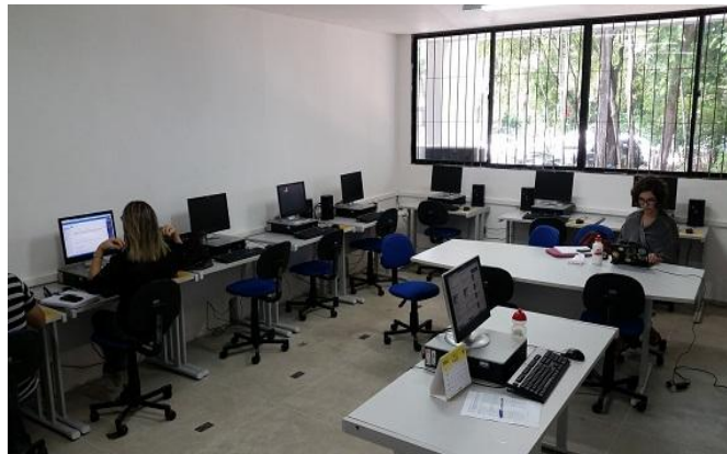
Laboratório de Informática Jurídica –DCJ – Santa Rita