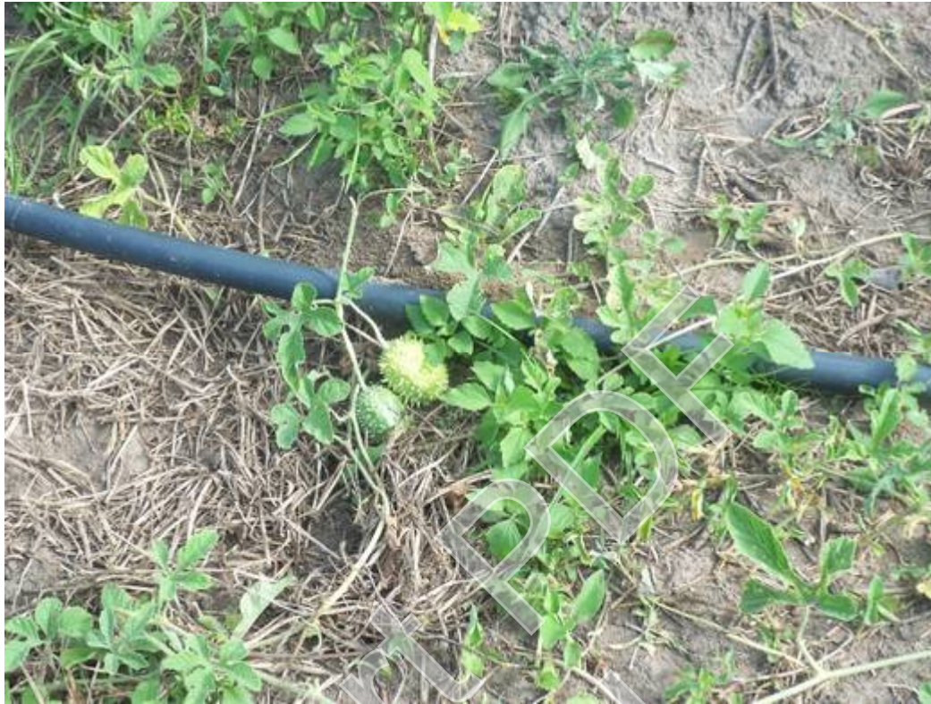
Figura 9 - Plantação de maxixe, Autor: José Joélison, 27/08/2015.