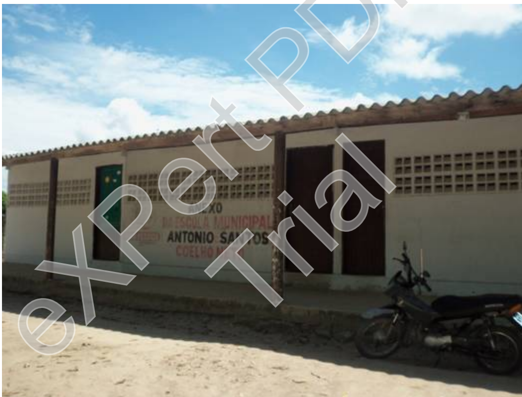
Figura 18 - Anexo da escola Municipal Antônio Santos Coelho Neto localizado na área dos posseiros Autor: José Joélison, 21/04/2015.

Cabe ainda destacar que na a área a ser reintegrada existem 48 habitações, energia elétrica, um anexo da escola municipal Antônio Santos Coelho Neto construído pela PMJP (figura 18) onde são alfabetizados crianças e adultos, porém, distribuição de água encanada ainda é esperada.