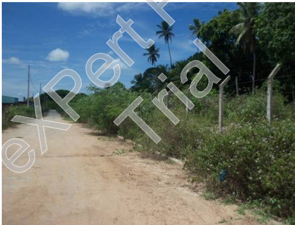
Figura 2 - Área limítrofe entre loteamento e área rural em Gramame, João Pessoa. Autor: José Joélison, 21/04/2015.

Como consequência desses processos de expansão urbana, do maior desenvolvimento dos meios de transporte e de comunicações e da maior incorporação da ciência, da tecnologia e da informação em parte do setor agropecuário nacional, o espaço rural tendeu a apresentar maior complexidade e heterogeneidade em termos da sua organização