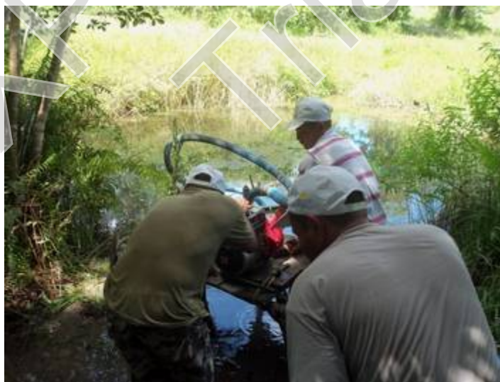
Figura 19 e 20 - Posseiros fazendo ajustes na base da motobomba antes de testá-la Autor: José Joélison, 21/04/2015.

Vemos através de várias figuras expostas neste trabalho que os posseiros de Ponta de Gramame não lutam só pela permanência na terra, mas também, pela permanência de seu sustento, a pergunta que eu ouvia era uma só: “ Se agente sair daqui, vamo pra onde? ”