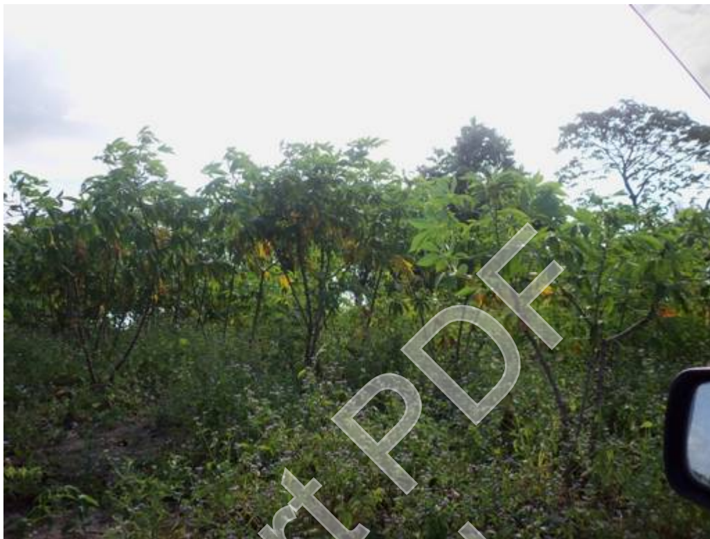
Figura 11 - Plantação de macaxeira, Autor: José Joélison, 27/08/2015.