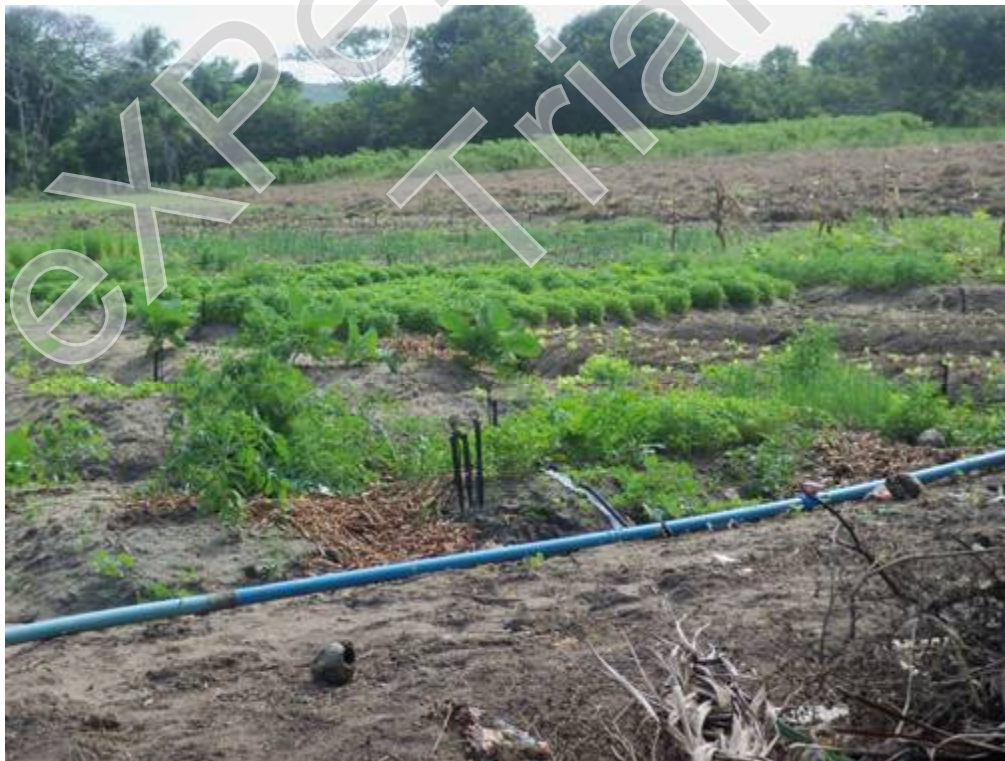
Figura 10 - Plantação de hortaliças, Autor: José Joélison, 27/08/2015.