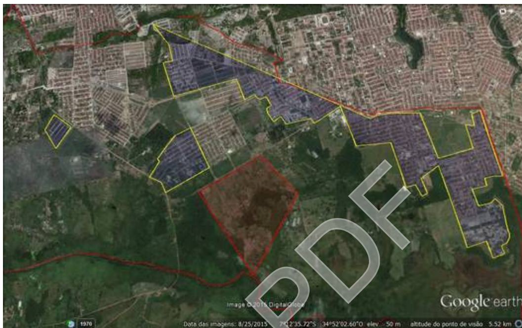
Figura 21 - Polígonos ilustrando expansão habitacional no bairro de Gramame

A criação de loteamentos é o principal motivo para os Falcones (proprietários das terras) está querendo expulsar os posseiros das terras. É muito mais lucrativo lotear e vender os lotes por uma taxa absurdamente cara do que ser indenizado pelo Governo Federal pela compra da área para fins de reforma agrária. Como já foi falado, este é o motivo principal do entrave da desapropriação das terras em Ponta de Gramame. As imagens a seguir mostram alguns lotes de loteamentos criados a mais de 1 ano no Bairro de Gramame e alguns ainda nem estão cadastrados da PMJP.