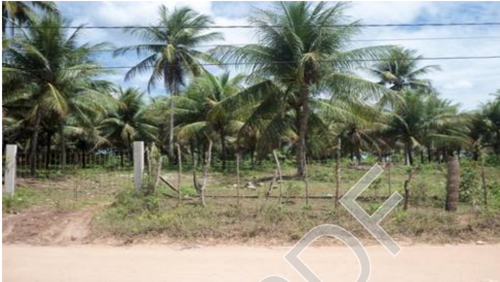
Figura 1 - Plantação de coqueiros em Gramame, área rural de João Pessoa. Autor: José Joélison, 21/04/2015.