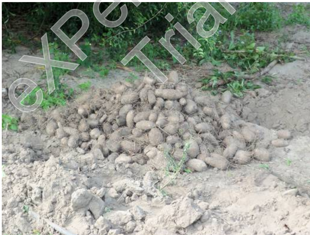
Figura 8 - Inhames recém-cultivados da plantação de seu Doda, Autor: José Joélison, 27/08/2015.