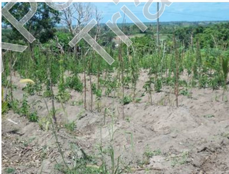
Figura 5 - Plantação de inhame de um posseiro na área da antiga fazenda Ponta de Gramame