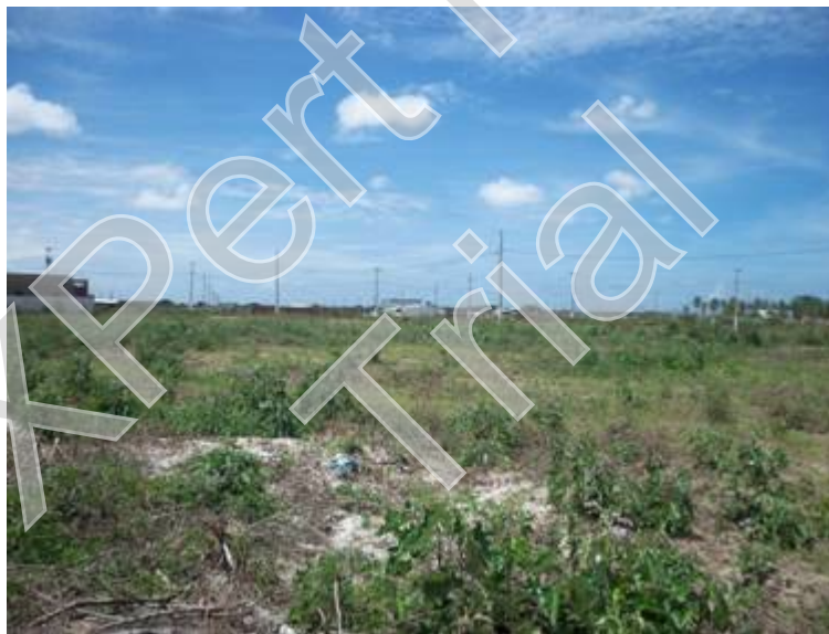
Figura 22 e 23 - Lotes vazios em loteamentos no Bairro de Gramame

Para Rodrigues (1994, p. 17), “ A terra é uma mercadoria que tem preço, que é vendida no mercado, e que não é reproduzível, ou seja, tem um preço que independe de sua produção”. Rodrigues está mostrando que diferente da mercadoria que tem seu valor estipulado pelo processo de produção a terra se auto-valoriza sem um processo de produção, sem a força do trabalho. A terra não tem valor de produção, mas tem um preço.