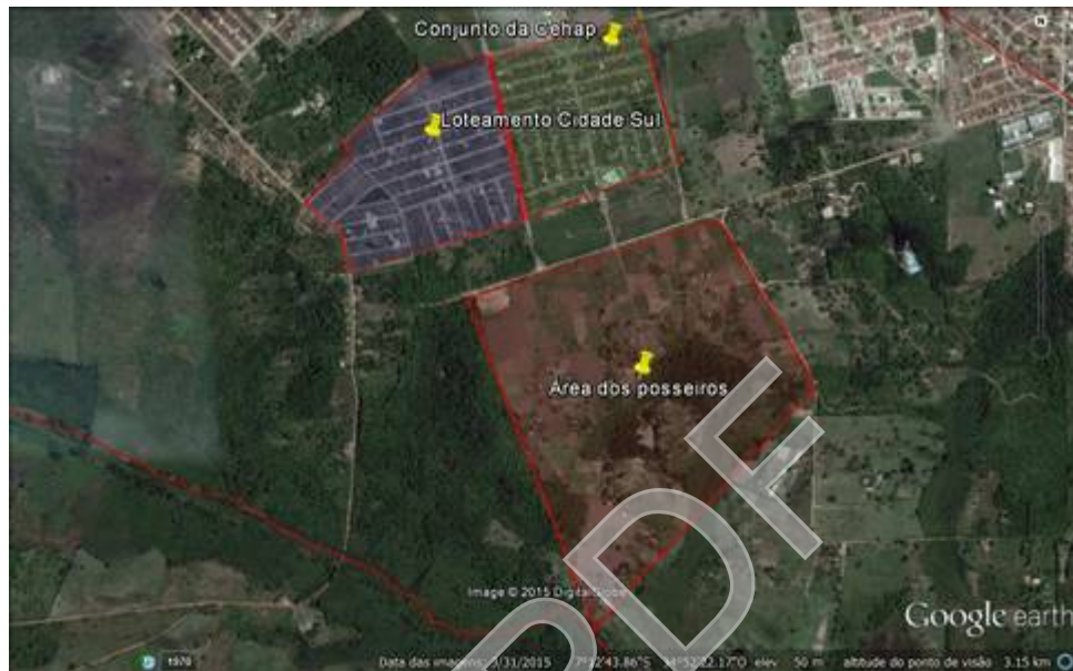
Figura 4 - Áreas urbanizadas próximo aos posseiros