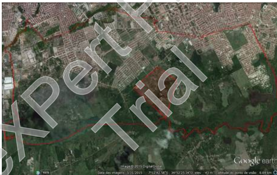
Figura 3 - Área do Bairro de Gramame com destaque da área de conflito entre posseiros e proprietários

A figura 3 mostra com perfeição a separação entre o urbano e o rural, não precisa de muito conhecimento técnico para enxergar esta divisão. Vemos que mais da metade do bairro de Gramame é composto de área rural, e também podemos enxergar a crescente expansão urbana em direção a área de conflito que está destacada em vermelho.