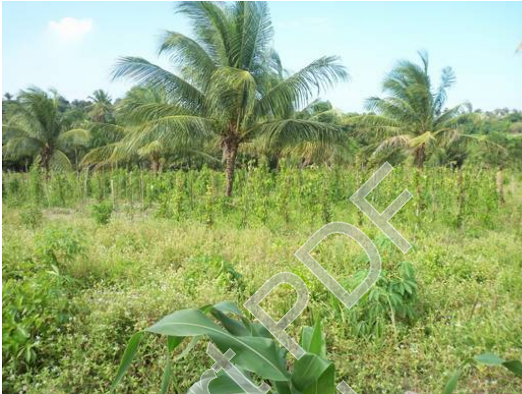
Figura 7 - Plantação de inhame e coco - Autor: José Joélison, 27/08/2015.