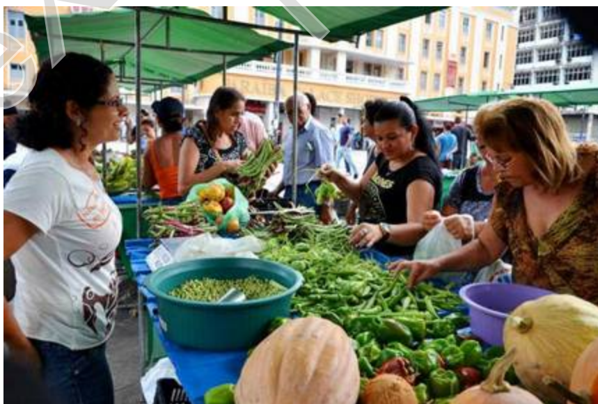
Figura 17 - II edição da Feira Agroecológica da Reforma Agrária, Ponto de Cem Réis, centro de João Pessoa.

De acordo com a Comissão da Pastoral da Terra, existem em funcionamento 39 feiras ecológicas na Paraíba. Em João Pessoa, elas funcionam no Ponto de Cem Reis (figura 19), CAMPUS I da Universidade Federal da Paraíba (imagens 15, 16, 17 e 18), Praça da Paz dos Bancários, no Bairro do Bessa, na Sede do Dnocs. Mas também são instaladas em Campina Grande, Sapé, Cajazeiras, Aparecida, Jacaraú, entre outros municípios.