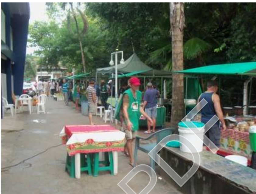
Figura 16 - Área de comercialização de comidas na feira da UFPP Autor: José Joélison, 21/08/2015.

De acordo com a Comissão da Pastoral da Terra, existem em funcionamento 39 feiras ecológicas na Paraíba. Em João Pessoa, elas funcionam no Ponto de Cem Reis (figura 19), CAMPUS I da Universidade Federal da Paraíba (imagens 15, 16, 17 e 18), Praça da Paz dos Bancários, no Bairro do Bessa, na Sede do Dnocs. Mas também são instaladas em Campina Grande, Sapé, Cajazeiras, Aparecida, Jacaraú, entre outros municípios.