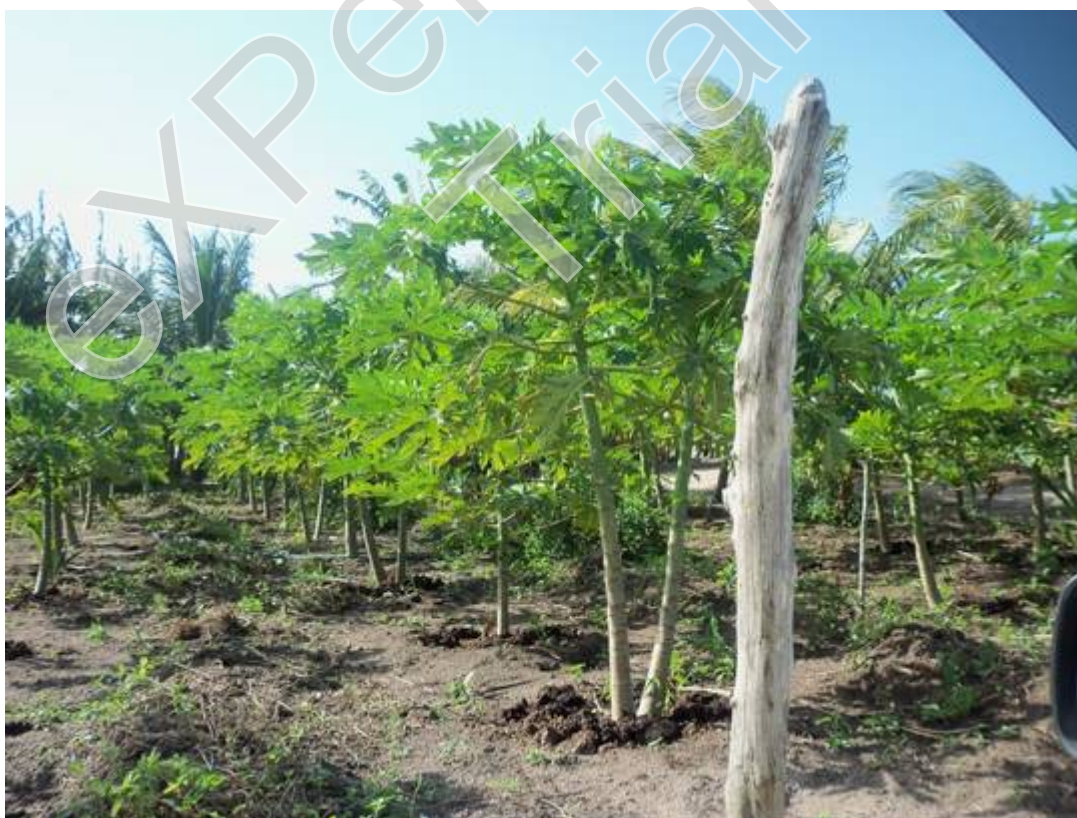
Figura 12 - Plantação de mamão, Autor: José Joélison, 27/08/2015.