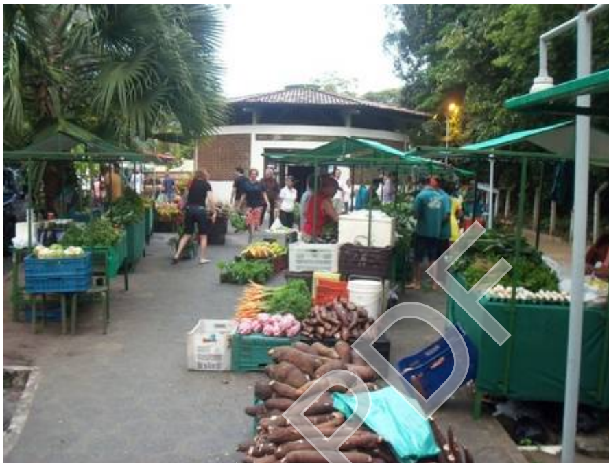
Figura 14 - Bancas de frutas, verduras e hortaliças de posseiros de várias regiões da Paraíba. Autor: José Joélison, 21/08/2015.