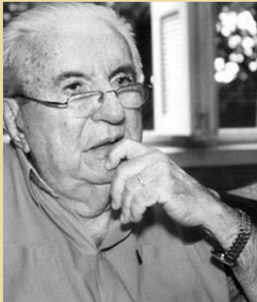
VINGT - UN ROSADO

Idealizada por Dix-sept Rosado e dirigida por Vingt-un Rosado até o seu falecimento em Janeiro de 2006. Os temas que possuem mais títulos são os referidos a temáticas das secas e sobre a família Rosado.