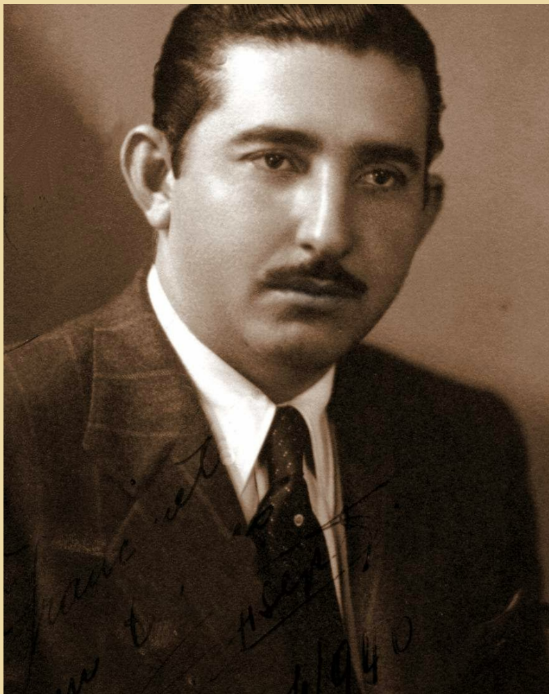
DIX - SEPT ROSADO