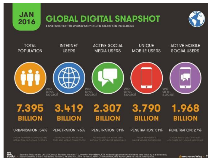
Figura 3 – Instantâneo do Digital Global.

No Brasil cuja população é de 208.7 milhões de pessoas um pouco mais da metade da população têm acesso à internet como visto na Figura 4 cerca de 120,2