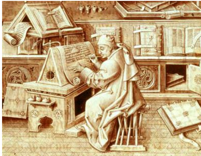
Figura 2 – Monge Copista.

e Particulares mantidas por imperadores e grandes senhores que carregavam suas bibliotecas “como parte normal da bagagem, [em suas viagens] da mesma forma que as suas roupas e a sua prataria.” (MARTINS, 1996, p. 88), tiveram certa importância também já que fizeram parte da influência na tomada de Constantinopla que marcou o fim da Idade Média. Outro tipo de biblioteca que pode ser considerado um dos maiores acontecimentos medievais foi o surgimento da Biblioteca Universitária que veio a influenciar o mundo, as primeiras a surgir foram nas universidades e Paris, Orléans, Cambridge que demandavam grandes quantidades de livros e formalizaram a profissão do bibliotecário como organizador de informação. (SANTOS, 2012).