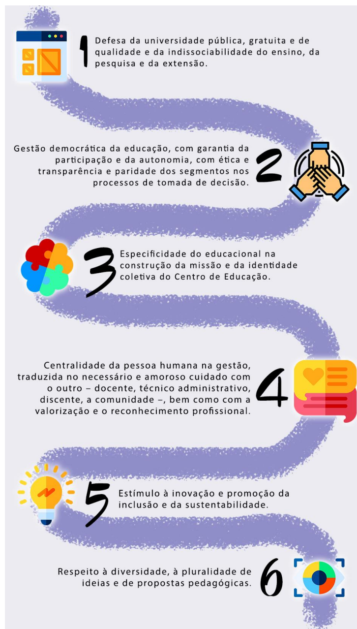
Figura 1 - Infográfico

Considerando uma concepção emancipatória e libertadora de educação e de Universidade, o planejamento coletivo encontra-se ancorado em um conjunto de princípios que orientarão as práticas de gestão do Centro de Educação para o quadriênio 2021 – 2025. São eles: