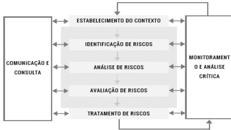
Figura 1 - Síntese do processo de gerenciamento de risco

avaliado. Todas essas etapas podem ser verificadas na Figura 1, em que está representando todo o processo de gerenciamento de risco.