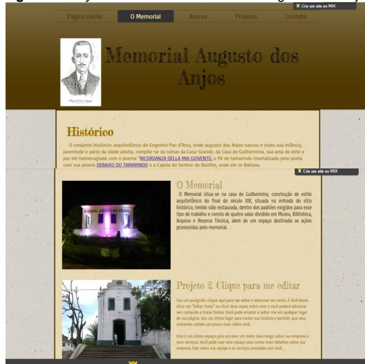
Figura 2 – Layout secundário do Memorial Augusto dos Anjos