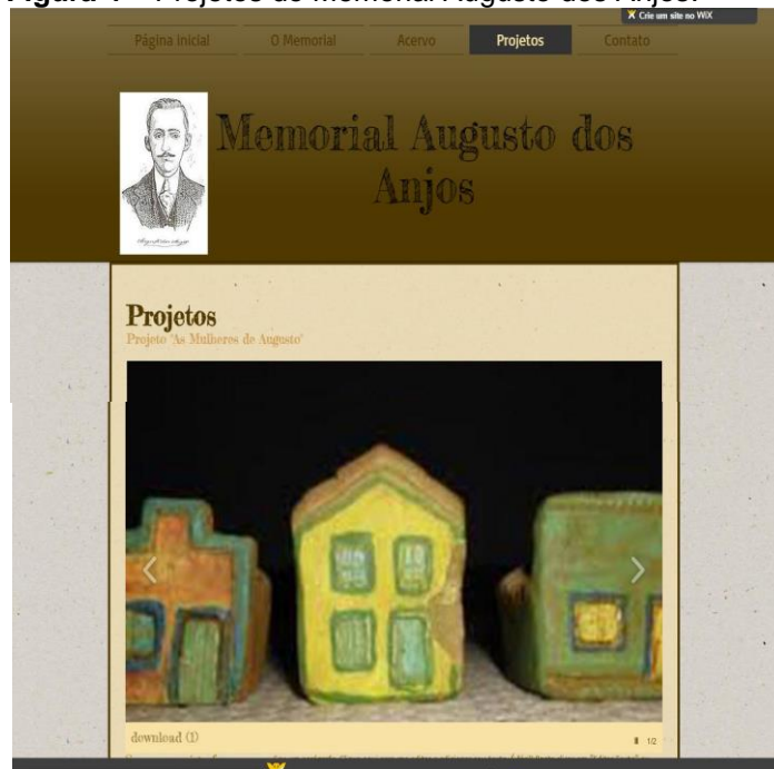
Figura 4 – Projetos do Memorial Augusto dos Anjos.