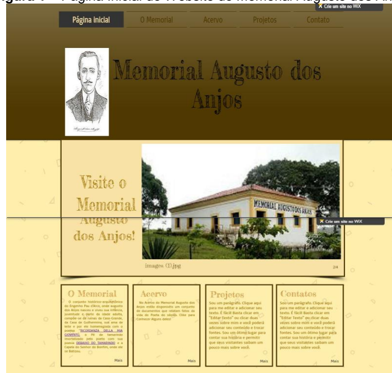
Figura 1 – Página Inicial do Website do Memorial Augusto dos Anjos

Para melhores esclarecimentos, traz-se abaixo a visualização do layout de apresentação criado para o website , conforme figura 1.