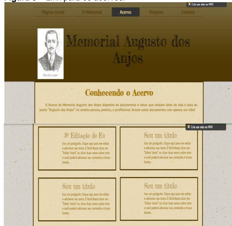
Figura 3 – Link para os acervos.