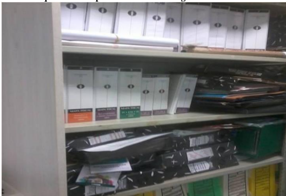
Foto do arquivo da Cooprev no início do estágio