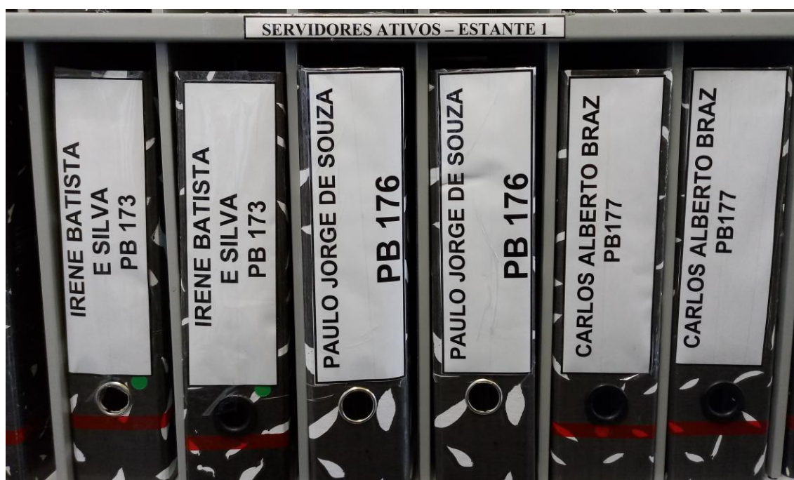
FIGURA 03: Assentamento funcional dos servidores

Ainda de acordo com Paes (2004, p. 40), “dificilmente se emprega um único método, pois há documentos que devem ser ordenados pelo assunto, nome, local, data ou número”. Portanto, o arquivo do NGP é organizado a partir da matrícula mais antiga de ingresso de cada servidor, em ordem crescente. Coloca-se na lombada da pasta uma etiqueta com o nome completo e a matrícula de cada servidor. A partir dessa numeração é que se localiza a pasta.