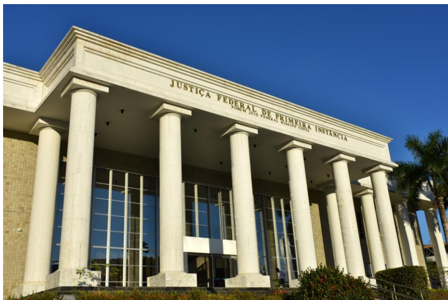
FIGURA 01: Prédio da Justiça Federal da Paraíba

A Justiça Federal da Paraíba fica localizada na sua capital denominada João Pessoa, especificamente no bairro Pedro Gondim, a mesma foi instaurada na cidade em 20 de março de 1968. Porém, foi apenas em 17 de fevereiro de 1995 que se mudou para sua atual sede, possuindo o nome de Justiça Federal de Primeira Instância, Fórum Juiz Federal Ridalvo Costa, o órgão tem como propósito atender as necessidades dos cidadãos por meio da sua competência jurídica.