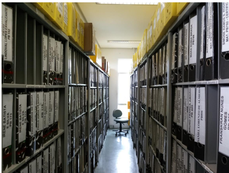
FIGURA 02: Arquivo do NGP