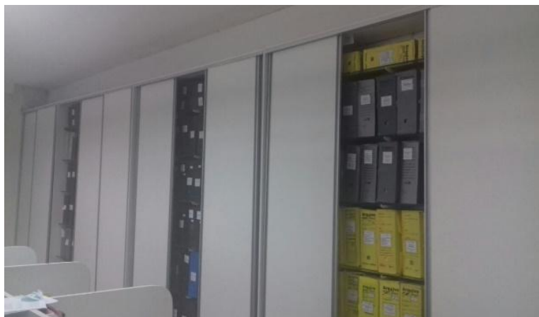
Figura 5 - Sala da Contabilidade

Na sala da contabilidade, ilustrada neste estudo pelas figuras 05, 06 e 07, funciona a parte do arquivo corrente, que consiste naquele que está em uso frequente, cujos documentos são armazenados em armários fechados com prateleiras de vidro, acondicionados em pastas classificatórias e em caixas-arquivos de polionda.