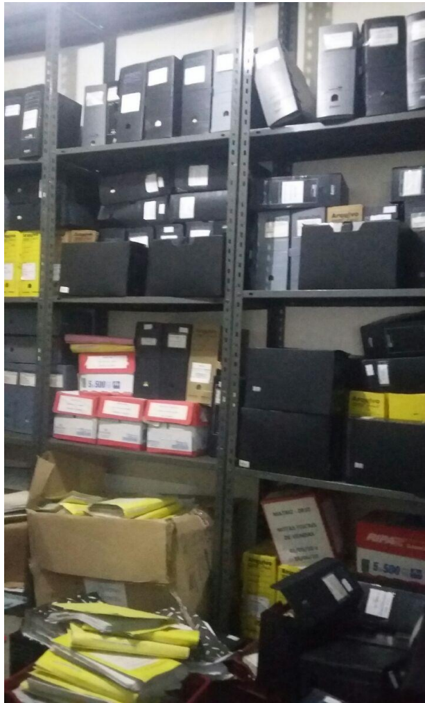
Figura 8 - Sala da Garagem

Na sala situada na garagem, então ilustradas pelas figuras 08, 09 e 10, são arquivados os documentos de fase intermediária, os quais são poucos consultados. Estes documentos aguardam sua destinação final que será a destruição ou o arquivamento permanente. Nesta sala os documentos estão acondicionados em caixas-arquivos de polionda, em caixas grandes de plásticos e de papel, e armazenadas em estantes de ferro.