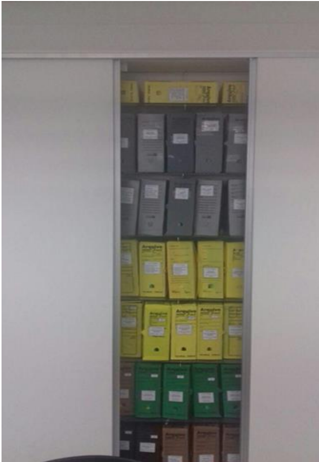
Figura 6 - Sala da Contabilidade