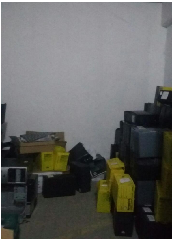
Figura 10 - Sala da Garagem