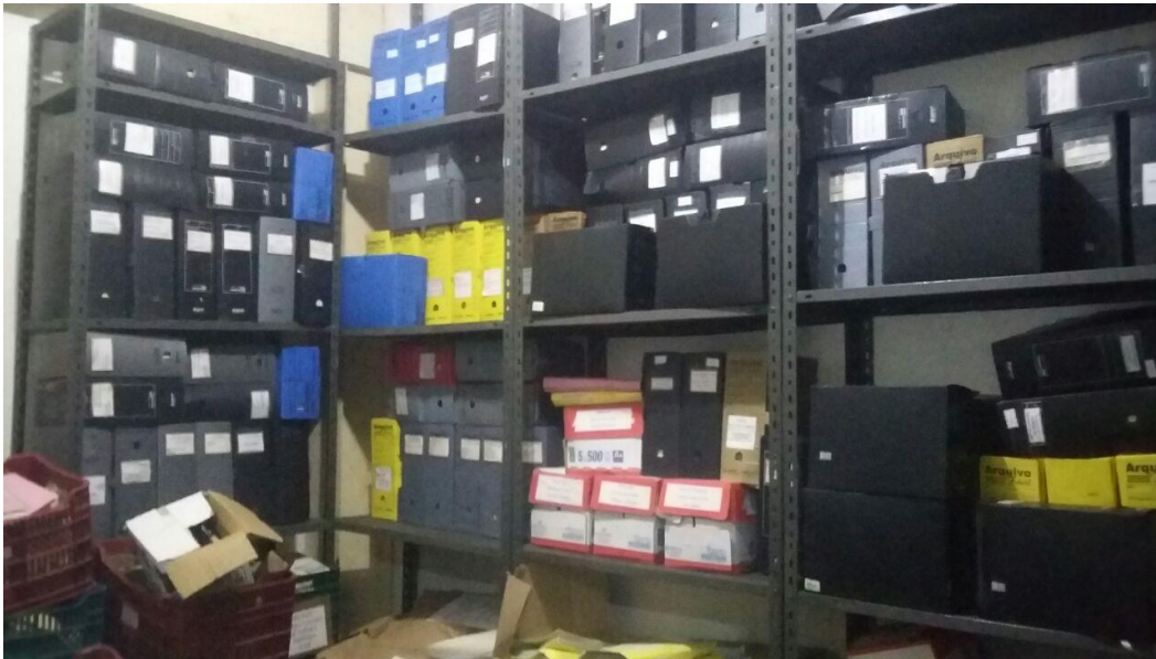
Figura 9 - Sala da Garagem