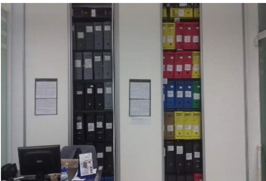
Figura 7- Sala da Contabilidade