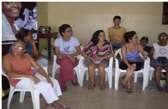
Foto 12: Reunião externa em uma comunidade no bairro de Cruz das Armas