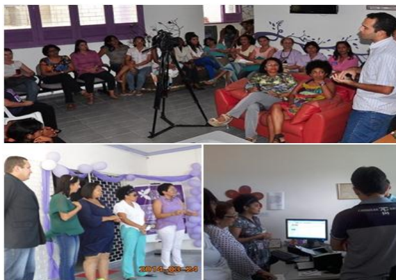
Foto 30: Lançamento do Sistema Atende Mulher