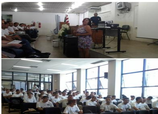
Foto 27: Participação do curso de Capacitação da Guarda Municipal

Participação do CRMEB no curso de capacitação dos guardas municipais com palestra e teatro, abordando o tema da violência contra a mulher, em 2013.