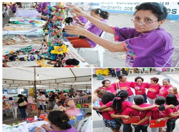
Foto 17: Feira de Mulheres Artesãs

Feira de mulheres artesãs, em 2011. O CRMEB atua no desenvolvimento de ações que contribuam para independência financeira das usuárias.